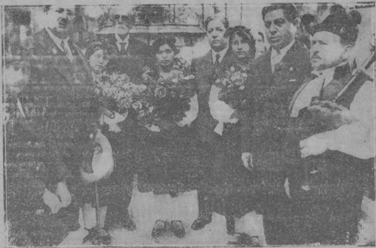
Barcelona: La rondalla «Airiños da Miña Terra», en su visita a la Diputación