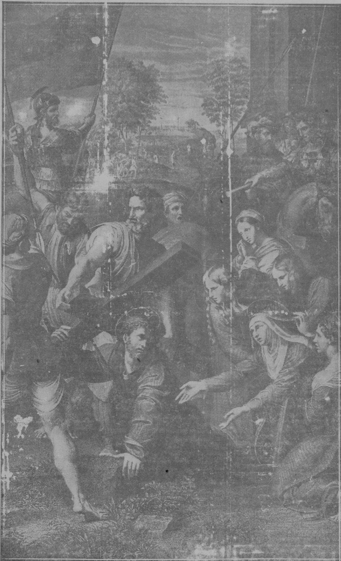
«Encuentro de Jesús y la Virgen», cuadro de Rafael Sanzio de Urbino