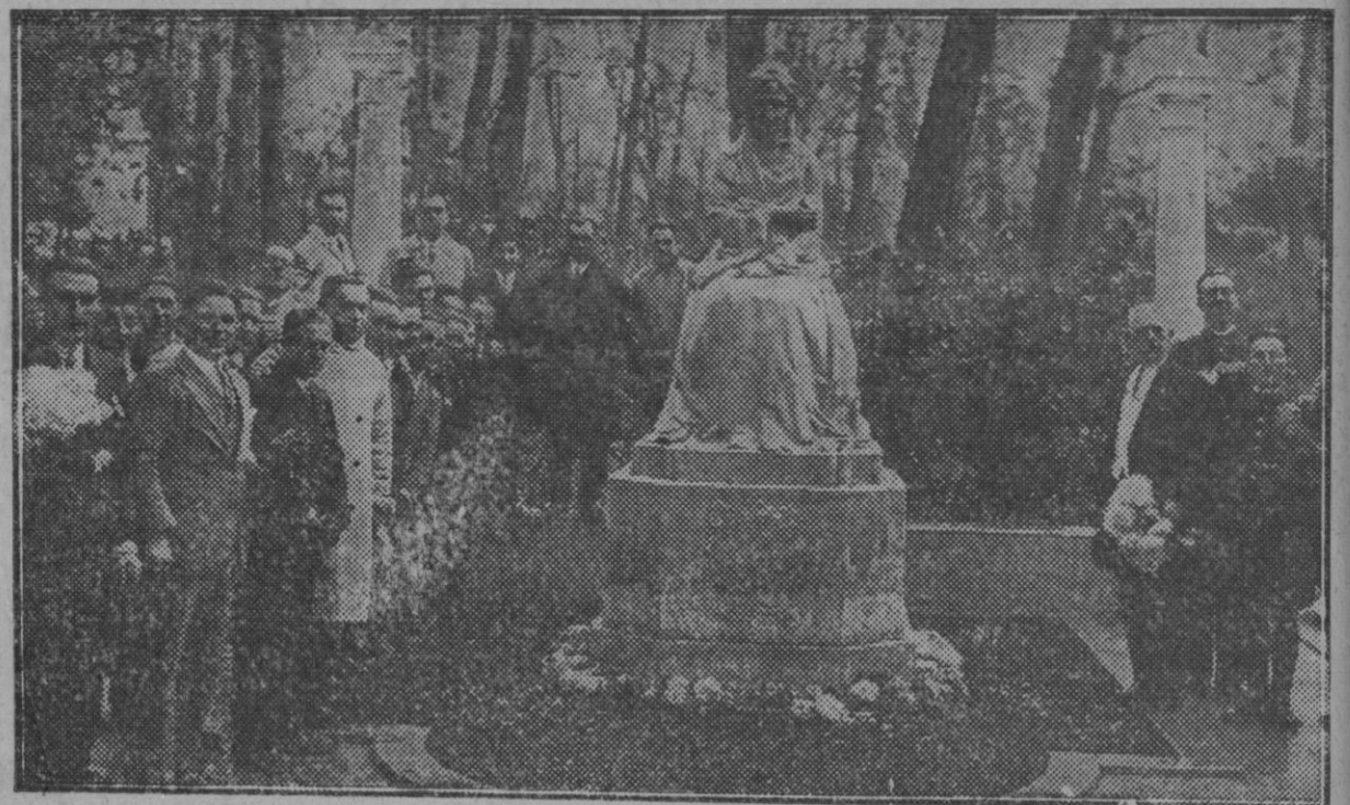
Los socios del Moto Club de Andalucía depositando flores en el monumento a la Infanta María Luisa, que donó el parque