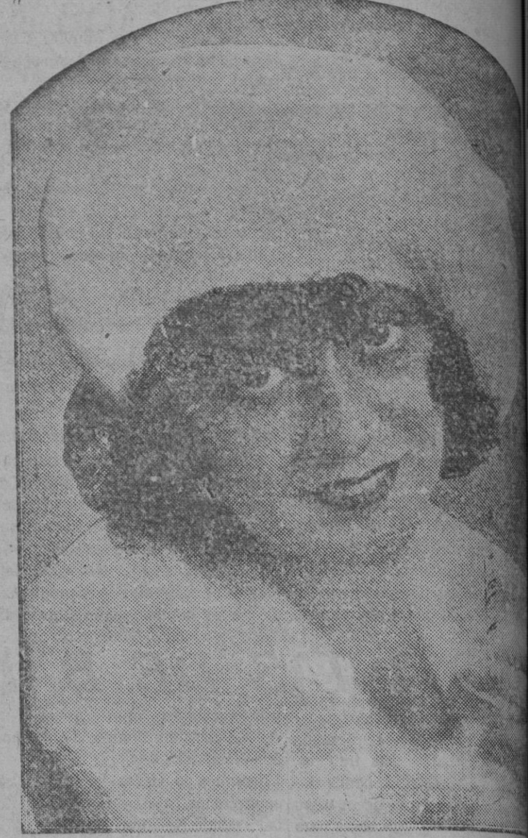
Leonor Ulrich, bellísima estrella de la pantalla, tocada con la boina escocesa Tam (en recuerdo del montañés Tam O'Shanier). Es de lana verde claro, y ha sido adoptada por las elegantes escocesas.