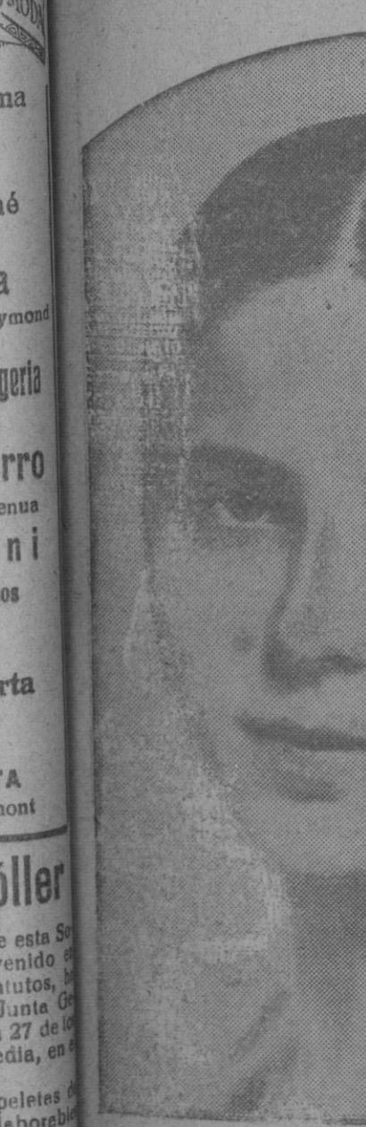
La hermosa muchacha que ha ido a Berlín para representar a Magdeburgo en el concurso de bellezas regionales de Alemania

rio, en honra de su patrón San Antonio Abad.