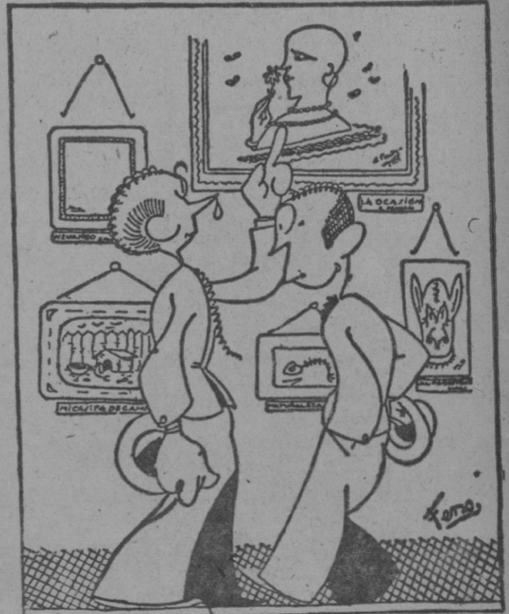
—No comprendo por qué a ese retrato femenino le titulen «La Ocasión». —Porque a «la ocasión» la pintan calva.

Advertimos a nuestros comunicantes que toda la correspondencia relativa al periódico, excepto la administrativa, debe ir dirigida a la Dirección del mismo.