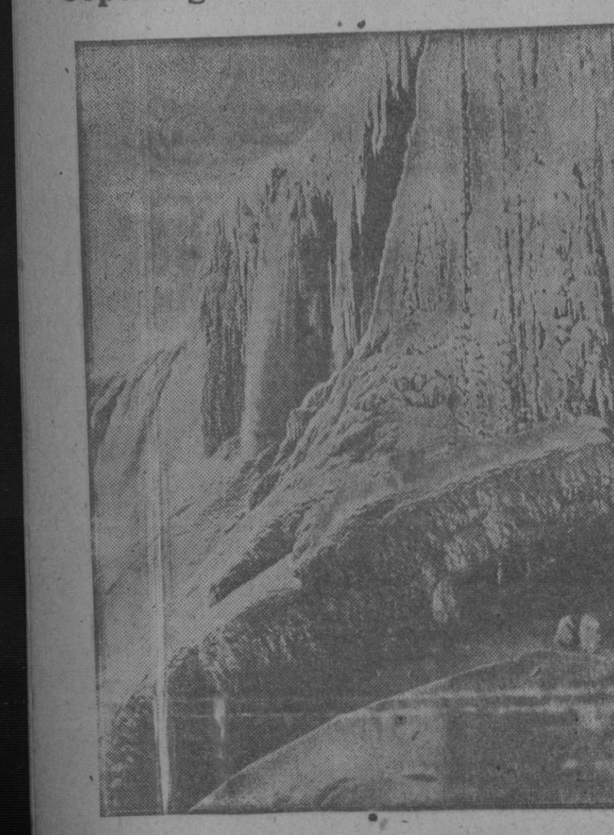
Varias ciudades de Suecia, en situación crítica.—Pintoresco aspecto de las cataratas del Niágara, completamente cristalizadas por el hielo