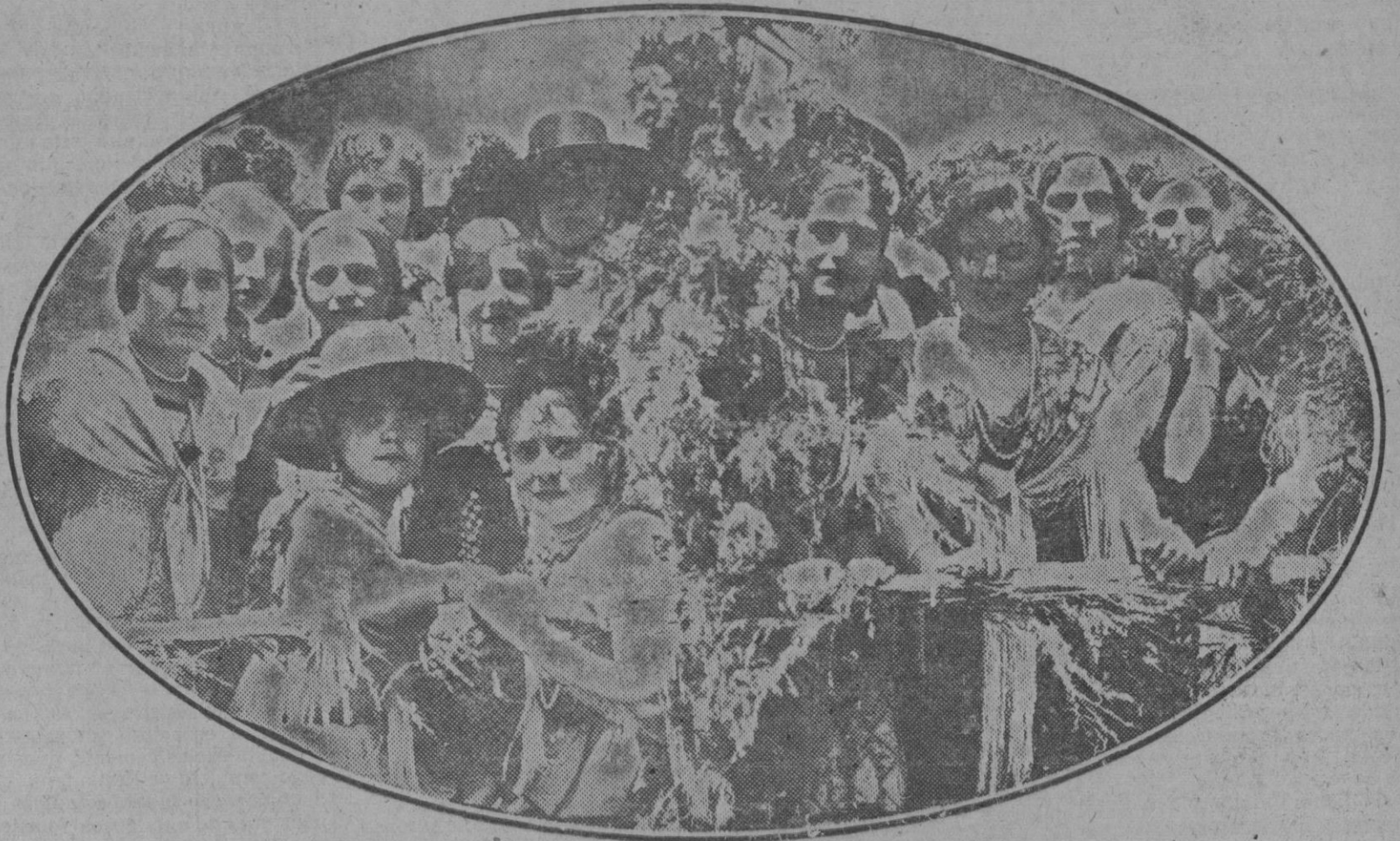
Castilblanco (Sevilla): Una carreta de bellas trianeras que tomaron parte en la romería de San Benito, celebrada en dicho pueblo