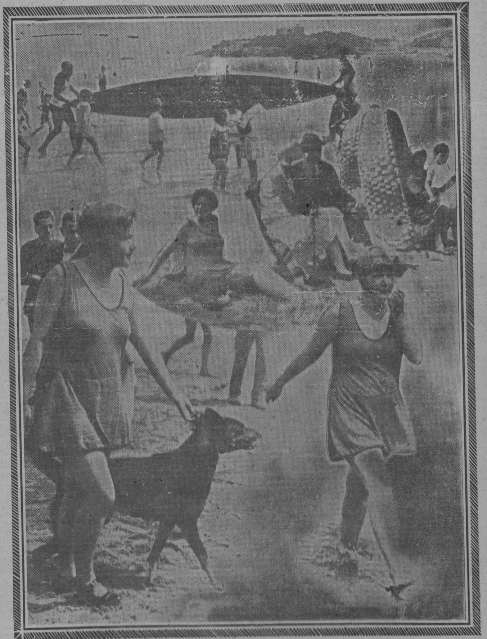
Santander: La hora del baño en la playa del Sardinero durante el mes de Agosto