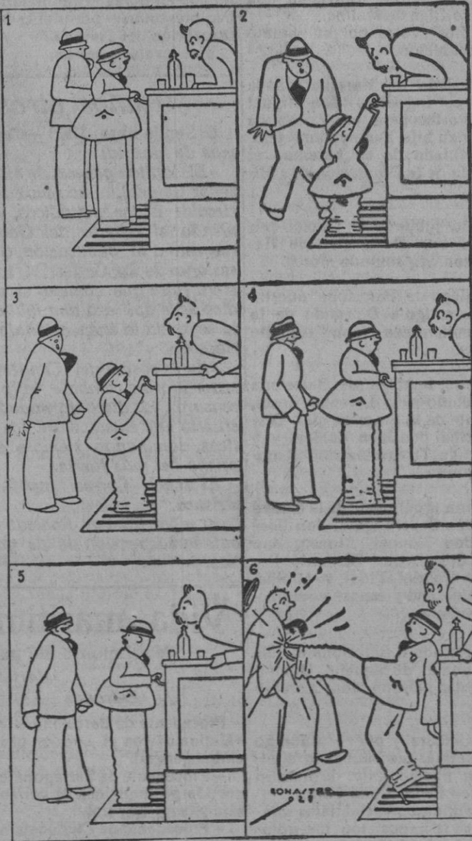
El misterio de las plenas de acordeón.