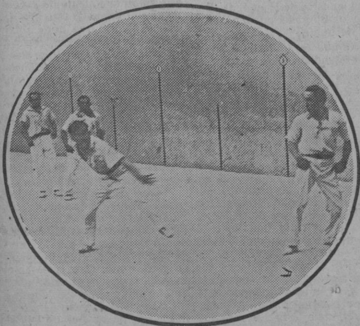
Bilbao: Un aspecto del partido de pelota a mano organizado por la Asociación de la Prensa, en el que se disputó la Copa Ugarte