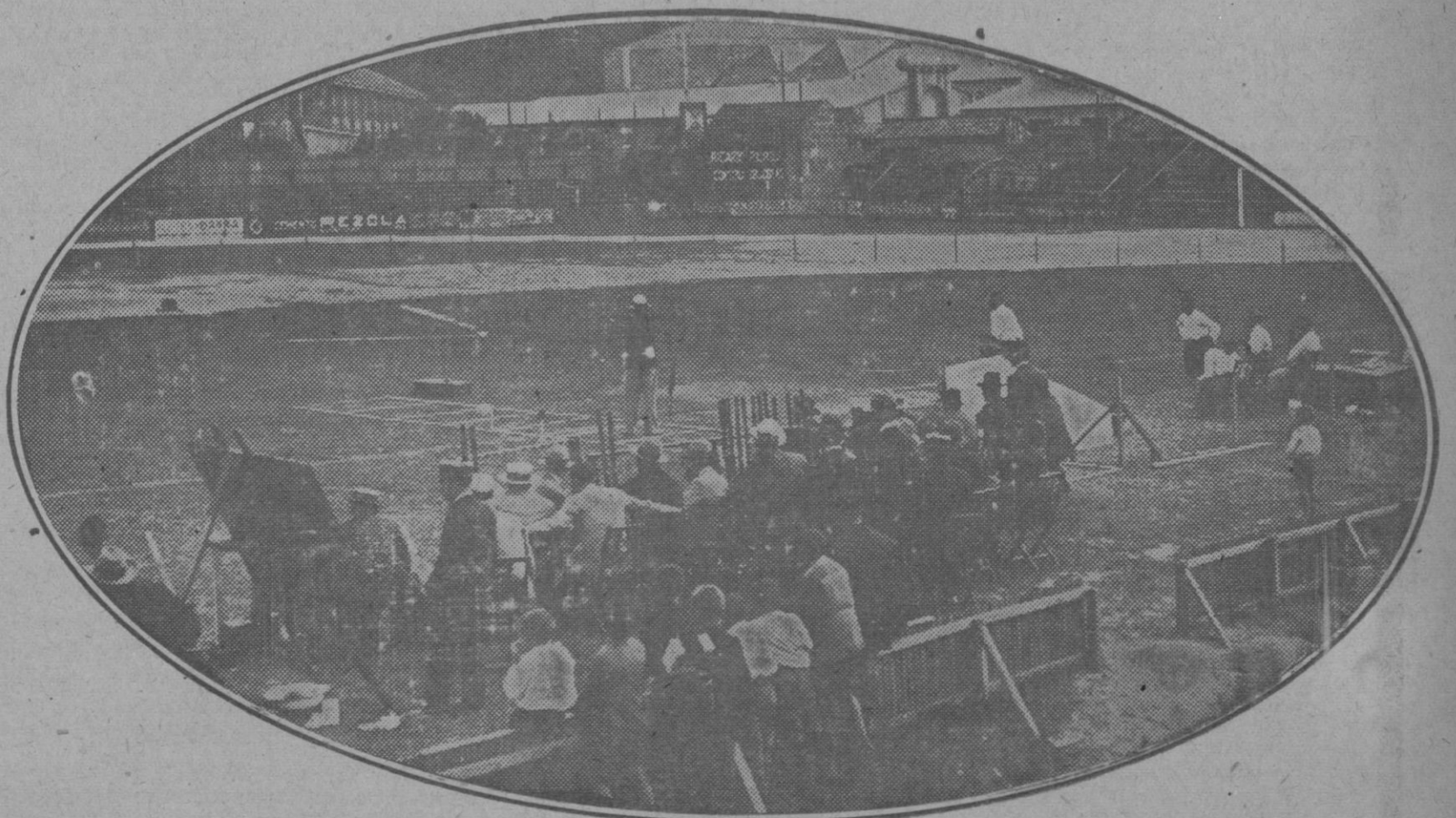
Un aspecto del campo del Celta, donde se han efectuado las tiradas