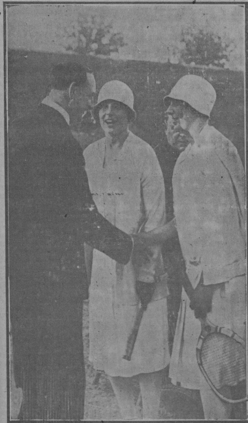
El embajador de los Estados Unidos licitando a Sus Altezas las Infantas después del partido de «tennis» jugado en el campo del palacio de la Magdalena