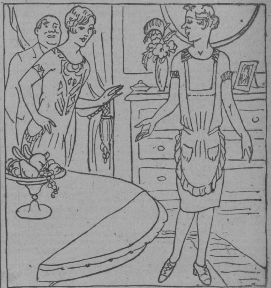
La señora.—Como a las nueve de la mañana ya tiene la mesa puesta. La criada nueva.—Porque es mi día de salida y necesito arreglarme desde las diez.