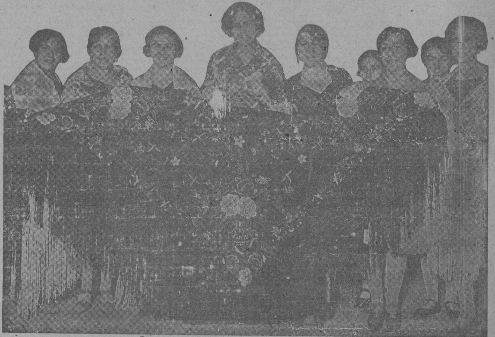
Grupo de señoritas con el precioso mantón que rifaron a beneficio del Montepío