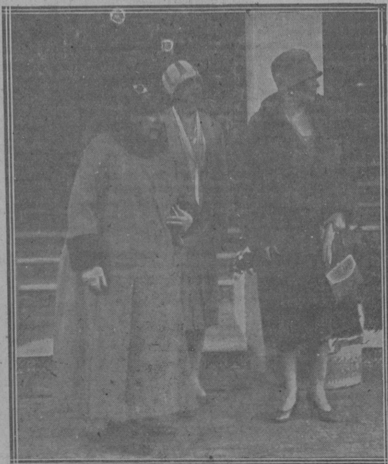
Su Majestad la Reina Doña Victoria, acompañada de su augusta madre, durante su estancia en esta capital