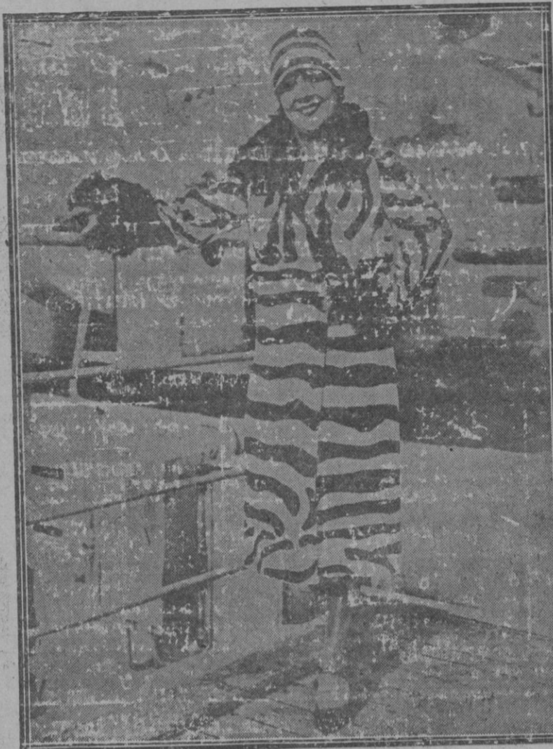
¿Querrán ustedes creerme si les decimos que este abrigo—de magnífica piel de cebra—le ha costado a su elegante propietaria la bonita cantidad de cinco mil libras esterlinas? Nosotros lo contamos tal como nos lo han contado