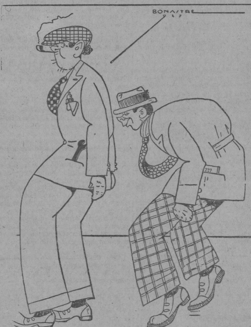
Gente de pedal