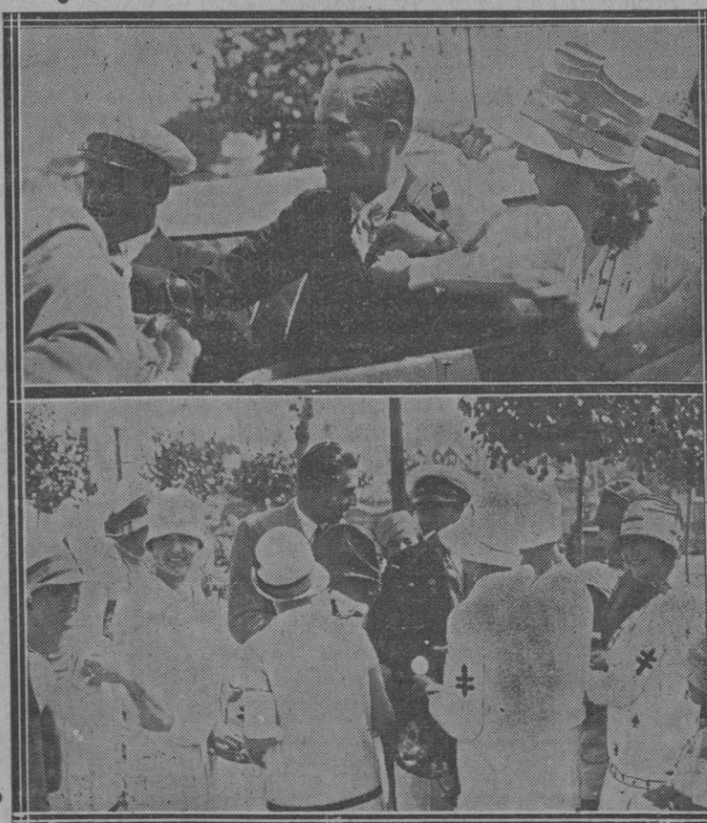
Arriba, el Príncipe de Asturias asaltado por un grupo de postulantes. Abajo, el Infante Don Jaime rodeado de distinguidas señoritas.