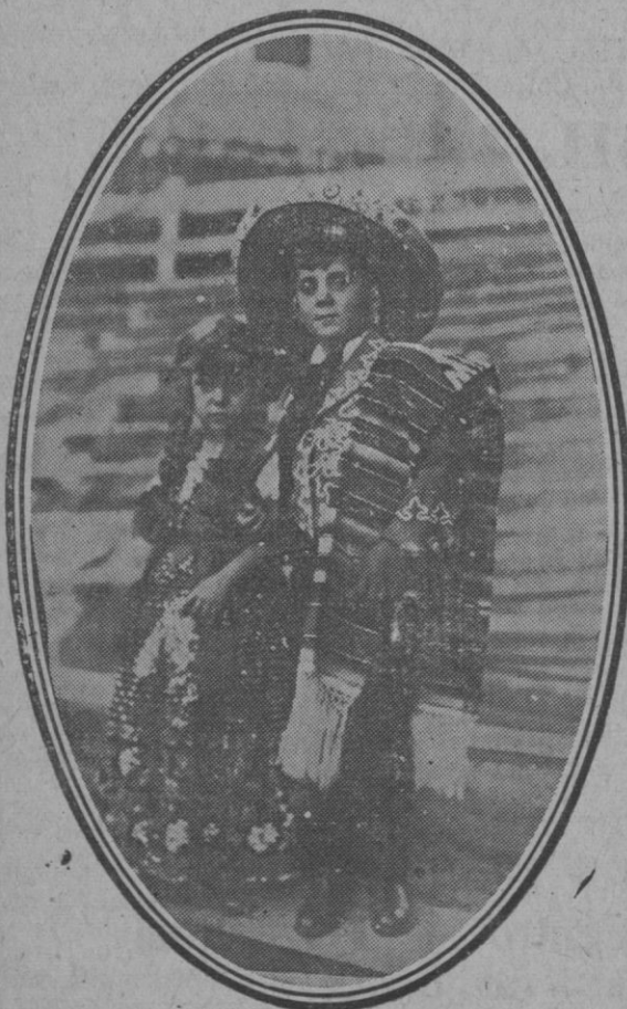
Niños con vestidos típicos del país, que obtuvieron el premio en el concurso de trajes organizado con motivo de las fiestas.