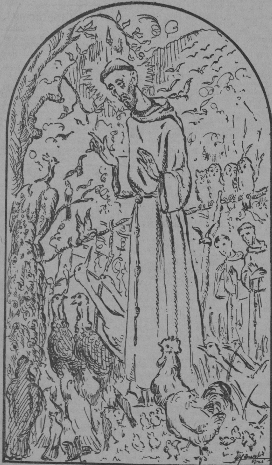
Dibujo, por Pedro Barceló