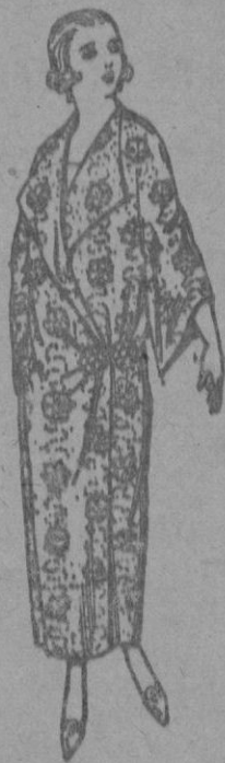
Batas de crespón estampado broche de adorno. a ptas. 25