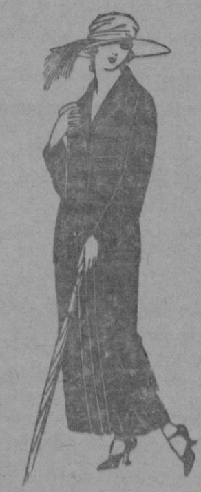
Tajes sastré, de sarga inglesa, popeline, etc., adornos bordados, chaqueta forrada de seda, en negro, azul y colores moda. a ptas. 120 a 135

Colón, 39 - PALMA DE MALLORCA SUCURSALES: Madrid, Barcelona, Alicante, Almería, Bilbao, Cádiz, Cartagena, Gijón, Granada, Málaga, Santander, Sevilla, Valencia, Valladolid, Zaragoza