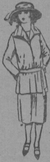
Tajes sastré, de gabardina, sarga inglesa, etc., en azul y color, para jovencitas de 13 a 15 años. a ptas. 75