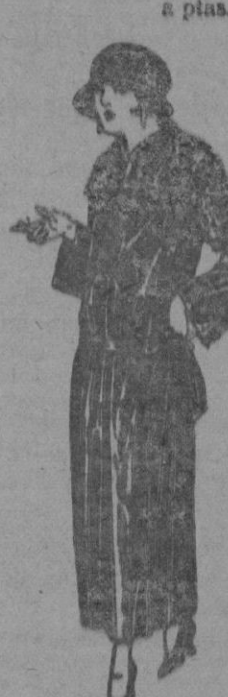
Abrigos de gabardina inglesa impermeabilizada, en negro, azul y color. a ptas. 130