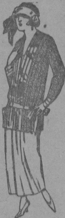
Paletots de punto de seda, dibujos novedad. a ptas. 90