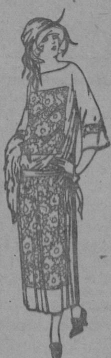
Vestidos de popeline, crespón, etc., en negro, azul y color, adornos bordados. a ptas. 130