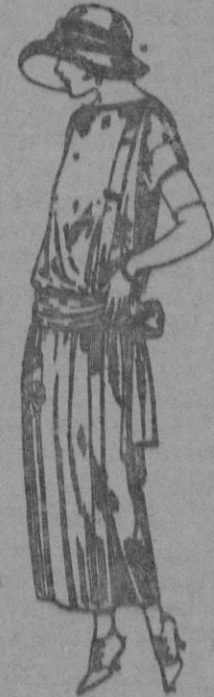
Vestidos de tricót de seda, en negro, azul y colores moda, adornos bordados a mano. a ptas. 125