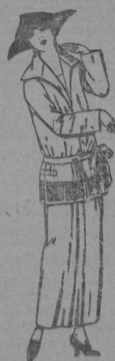
Tajes sastré, de gabardina, sarga inglesa, etc., adornos bordados, en negro azul, y colores moda. a ptas. 115