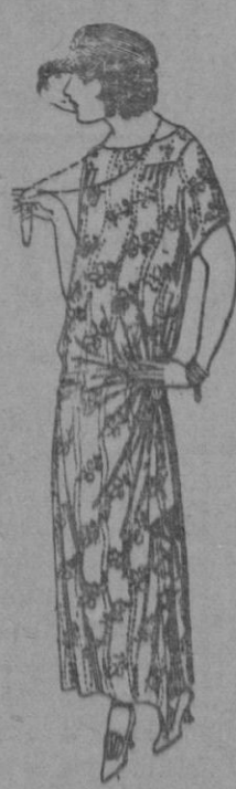
Vestidos de voile, dibujos moda, adornos plisados, broches fantasia. a ptas. 65