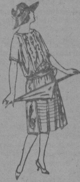
Vestidos de voile, adornos bordados para jovencitas de 13 a 15 años. a ptas. 40