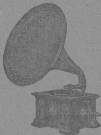
Compro V. un acreditado "PARLOFON-CASTELLÁ" a pagar en 20 meses que es la mayor garantía