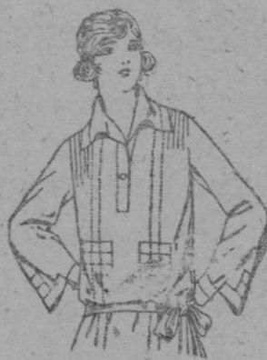
Blusas de crepón Seda en negro, azul y color, adornos calados. de ptas. 30 a 65