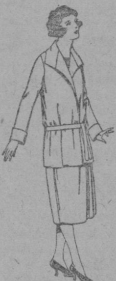
Trajes de estambre, lanilla, etc. en azul y color, para jovencitas de 12 a 15 años. de ptas. 80 a 100