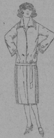
Abrigos de terciopelo de lana, gamuzeta, pañeta, etc. en negro, azul y color adornos bordados. de ptas. 30 a 85