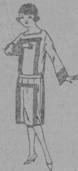
Vestidos de Sarga inglesa, gabardina, etc. en azul y color, para jovencitas de 12 a 15 años. de ptas. 63 a 80