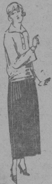
Faldas de Popeline, estambre, etc. en negro, azul y color. de ptas. 38 a 50