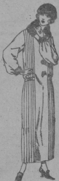
Vestidos de sarga inglesa crepé, etc. en negro, azul y color, adornos piel. de ptas. 125 a 160