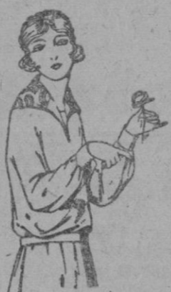
Blusas de punto de Seda diferentes colores, adornos bordados. de ptas. 55 a 75