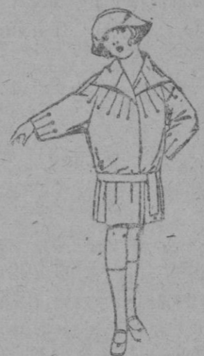
Abrigos de terciopelo de lana, en azul y color, adorno pespunte Seda, para niñas de 4 a 9 años. de ptas. 25 a 40

PÍDASE EL CATÁLOGO GENERAL Ventas al contado Precio fijo