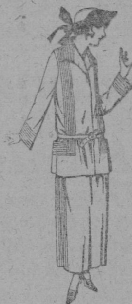
Trajes sastré, de popeline, estambre, etc. adornos pespunte seda, chaqueta forrada de seda en marino, negro y colores moda. de ptas. 125 a 160