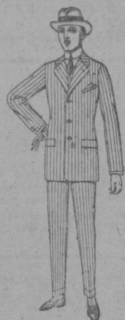
Trajes de Cheviot, patén, estambre, etc. de ptas. 38 a 135

SUCURSALES: Madrid, Barcelona, Alicante Almería, Bilbao, Cádiz, Cartagena, Gijón, Granada, Málaga, Santander, Sevilla, Valencia, Valladolid, Zaragoza