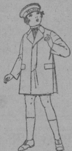
Gabanes de patén, gamuzeta, etc. para niños de 4 a 9 años. de ptas. 26 a 50

Trajes de estambre, lanilla, etc. en azul y color, para jovencitas de 12 a 15 años. de ptas. 80 a 100