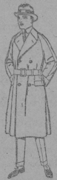
Gabanes cruzados de Cheviot, cower o pluma. de ptas. 95 a 135