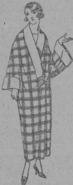
Batas de franela dibujos de novedad. de ptas. 27 a 38