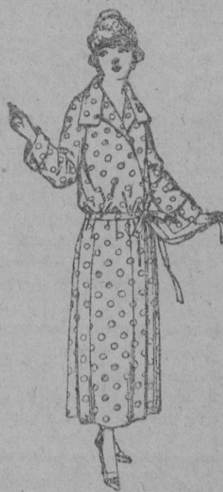
Batas de percal, voile listado, etc. de ptas. 16 a 22