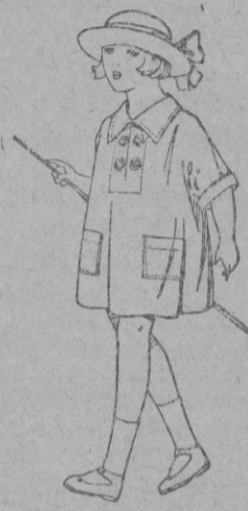
Vestidos de batista blanca, adornos bordados, para niñas de 3 a 6 años. de ptas. 6 a 8 años.

Gorras, Sombreros, Cinturones, Calcetines, Corbatas, Pañuelos, Fajas, Ligas, Tirantes, etc.