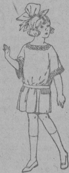
Vestidos de sarga inglesa, popeline, en azul y colores moda, para niñas de 4 a 9 años. de pts. 33 a 38

Ropas confeccionadas para Caballero, Señora, Niño y Niña