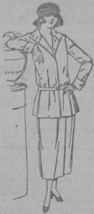
Trajes sastre, de estambre, gabardina, etc., chaqueta forrada de seda, en negro, marino y colores moda. de ptas. 115 a 145

SUCURSALES: Madrid, Barcelona, Alicante, Almería, Bilbao, Cádiz, Cartagena, Gijón, Granada, Málaga, Santander, Sevilla, Valencia, Valladolid, Zaragoza