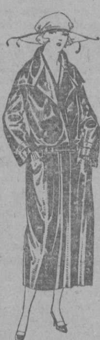
Abrigos de seda impermeables, en negro, azul y color. de ptas. 130 a 225