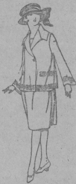
Vestidos de gabardina, sarga inglesa, etc., en azul y color, adornos bordados, para jovencitas de 13 a 15 años. de ptas. 93 a 110