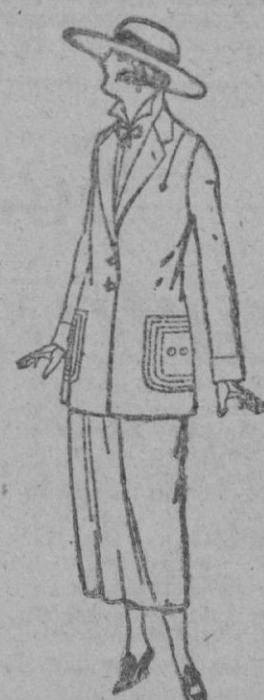
Trajes sastre, de popeline, gabardina, etc., adorno pespuntos seda, chaqueta forrada de seda, en negro, marrón y colores moda. de ptas. 120 a 140