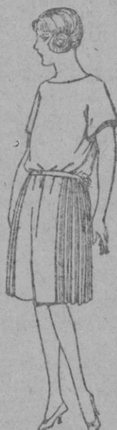
Vestidos de sarga inglesa, gabardina, etc., en azul y color, adornado de pespuntos seda. de ptas. 55 a 70