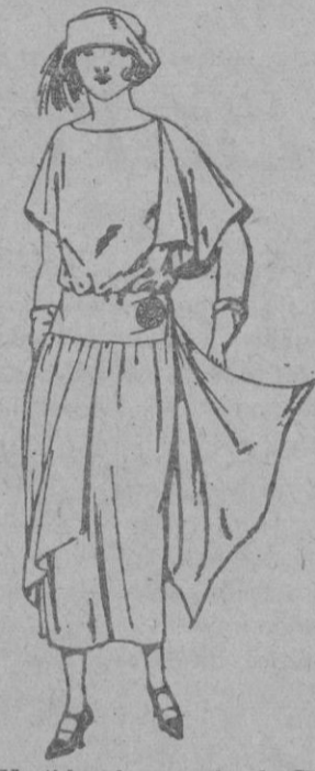
Vestidos de crepón de China, en negro, azul y colores moda, adornos hebillas metal. de ptas. 135 a 160