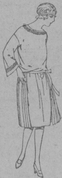
Vestidos de popeline, sarga inglesa, etc., en azul y color, adornos bordados para jovencitas de 13 a 15 años. de ptas. 60 a 78