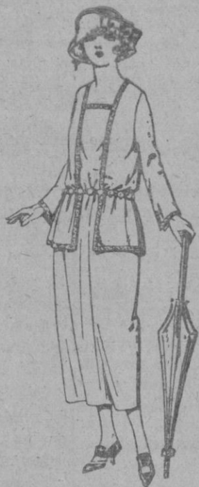
Vestidos de gabardina, sarga inglesa, etc., en negro azul y color, adornos cinta seda. de ptas. 63 a 90