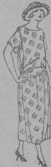
Vestidos de foulard de algodón, dibujos fantasía. de ptas. 35 a 50