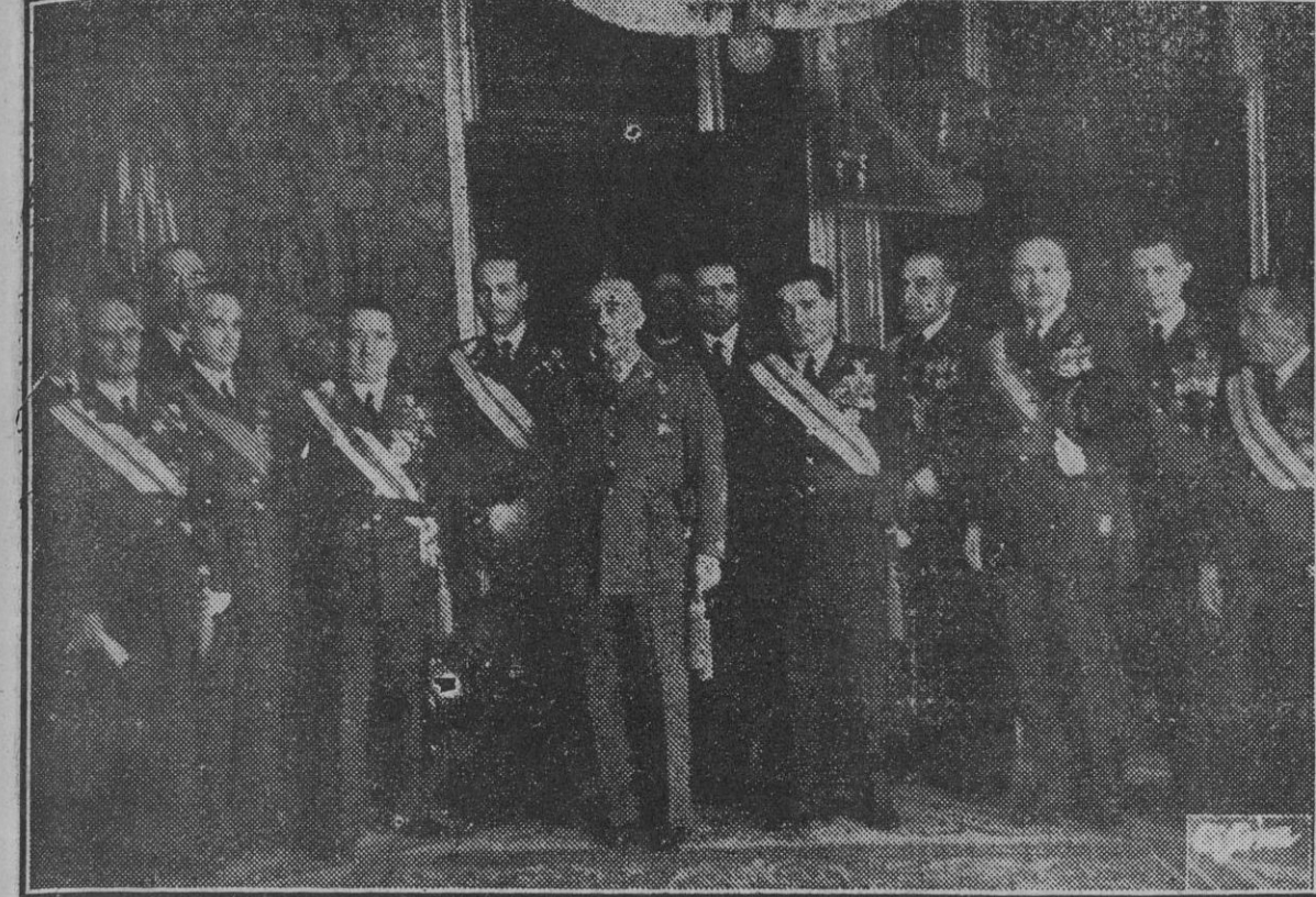
En ocasión de la festividad de Nuestra Señora de Loreto, Patrona del Arma de Aviación, el ministro del Aire, general González Gallarza...