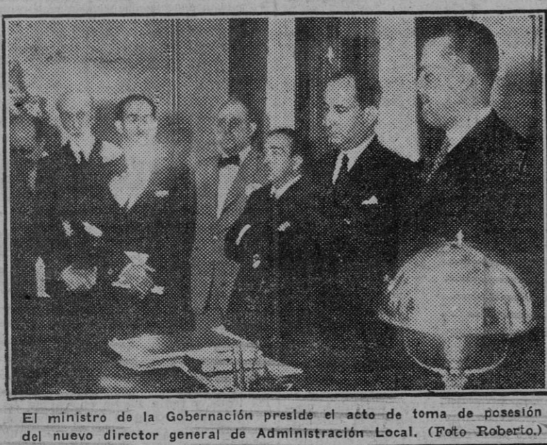
El ministro de la Gobernación preside el acto de toma de posesión del nuevo director general de Administración Local.