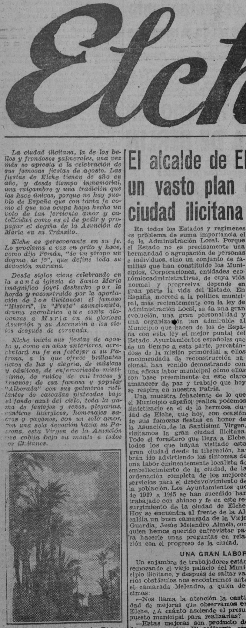
Aspecto del Palmeral de Elche