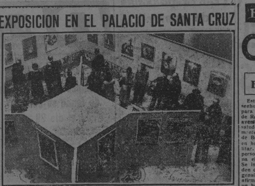
Exposición de tarjetas presentadas al concurso convocado por el Consejo Superior de Menores, que ha sido inaugurada en el Ministerio de Asuntos Exteriores.