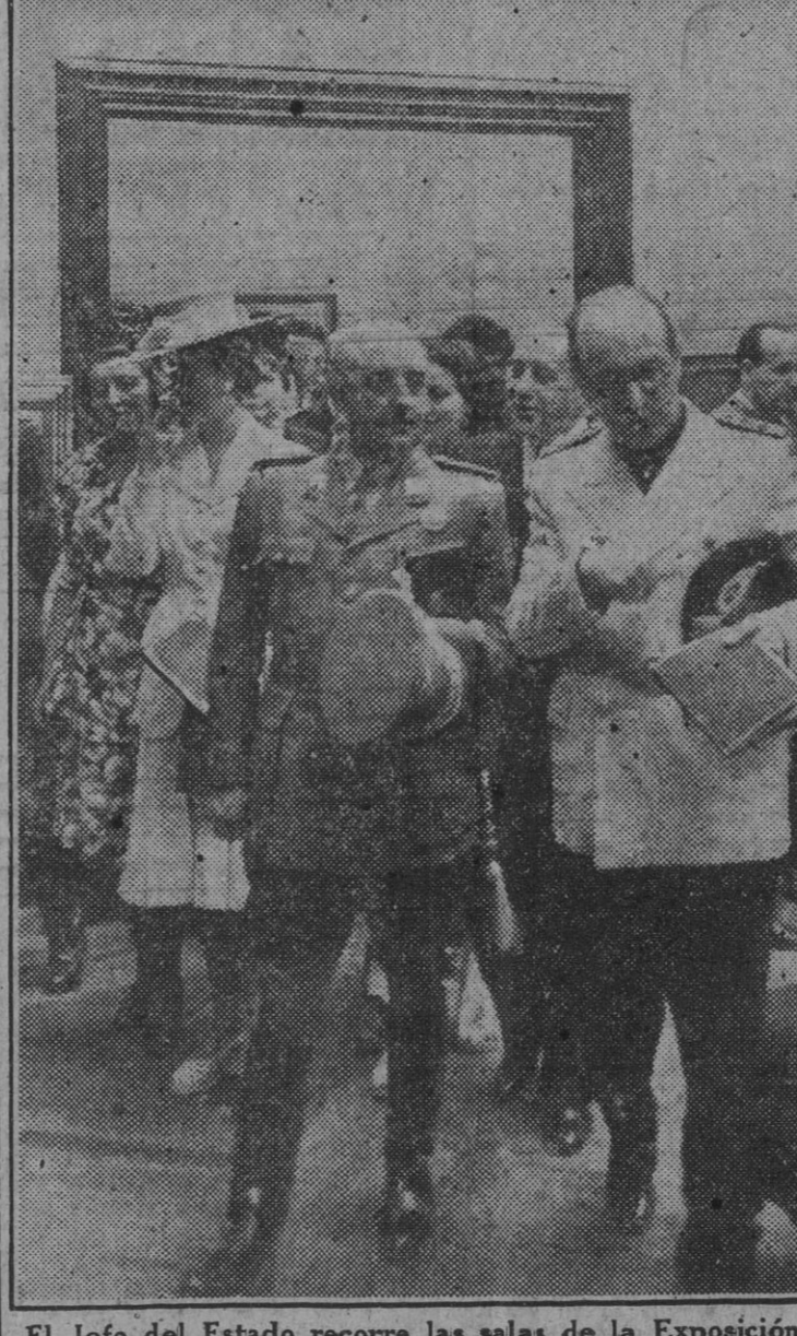
El Jefe del Estado recorre las salas de la Exposición de Bellas Artes.

Erres críticos que por tertulias y corrillos se dedican a la despreciable tarea de gastar las energías de su mente en despreciar a tonos y a loas la labor llevada a cabo por el régimen, debieran meditar en los hechos que ritmicamente y como obedeciendo a una vitalidad sana y completa va desarrollando el sistema la Organización Sindical.