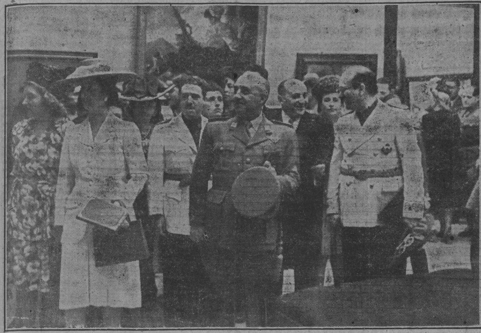
Acompañado por su esposa y por el ministro de Educación Nacional, el Caudillo visita la Exposición Nacional de Bellas Artes, inaugurada hoy.