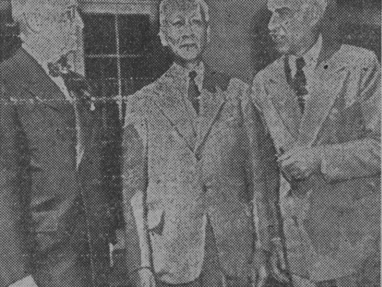
El Presidente Truman, Sergio Osmeña, Presidente de Filipinas, y Edward R. Stettinius, secretario de Estado norteamericano, durante su última reunión en la Casa Blanca de Washington.