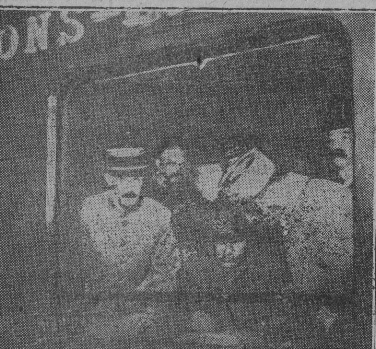
El mariscal Foch signando el armisticio el 11 de noviembre de 1918, en el coche donde los delegados se reunieron en Compiègne.

La situación de Alemania es brillante y desesperada. Se declinó en los primeros meses del año 1918. Las grandes ofensivas alemanas iniciadas el 21 de marzo—Somme, Lys, Aisne, Metz—, fueron de indudable eficacia, pero no lograron el resultado apetecido: asentar el golpe decisivo a los ejércitos aliados. Ante de que se agotara el último caballo del estable, buscó la manera de terminar, apremiaba el canciller Max von Baden al mariscal Hindenburg.