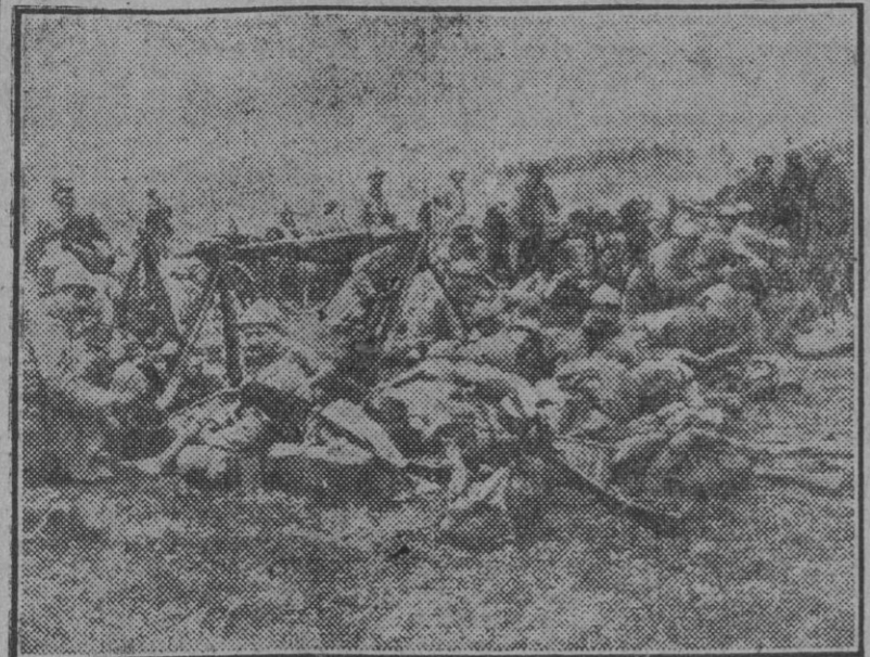
Tropas de vanguardia en el frente de Verdún el año 1916.