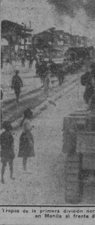
Tropas de la primera división norteamericana de Caballería entrando en Manila al frente de las restantes fuerzas.