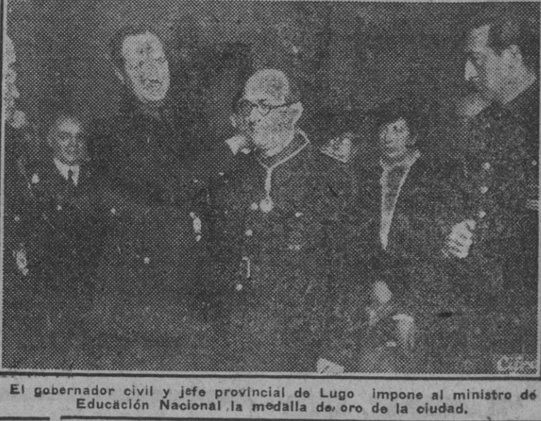
El gobernador civil y jefe provincial de Lugo impone al ministro de Educación Nacional la medalla de oro de la ciudad.