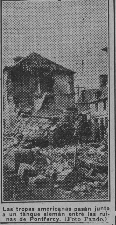
Las tropas americanas pasan junto a un tanque alemán entre las ruinas de Pontfarcy.