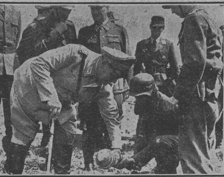
El mariscal del Reich Goering, en una posición del frente del Este, examina una bomba antitanque durante una visita de inspección a las unidades especializadas.