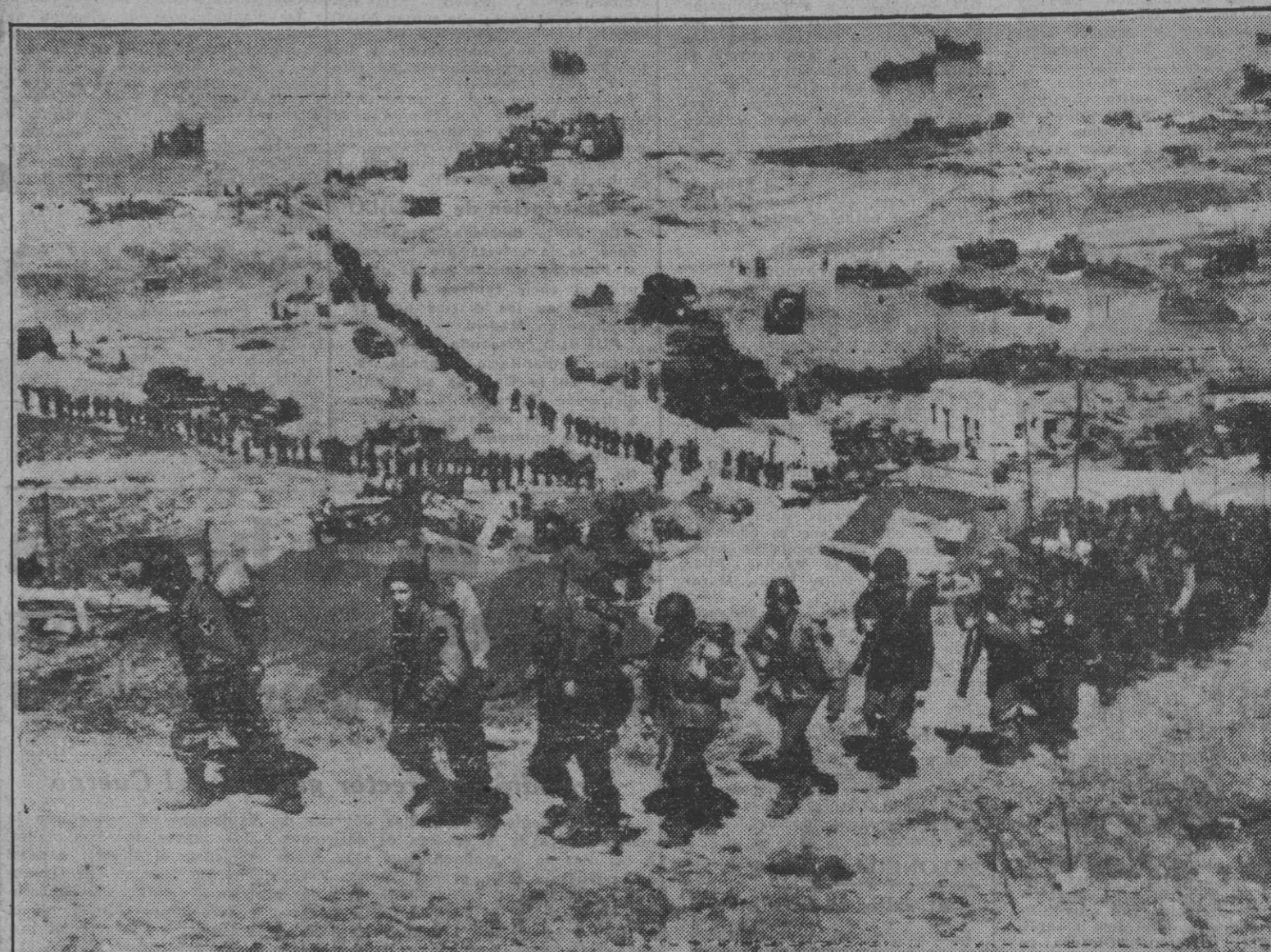
Interminables columnas de hombres y vehículos cargados con material bélico se internan en las playas normandas donde desembarcaron las tropas aliadas. La presente fotografía recoge un impresionante aspecto de la audaz operación.