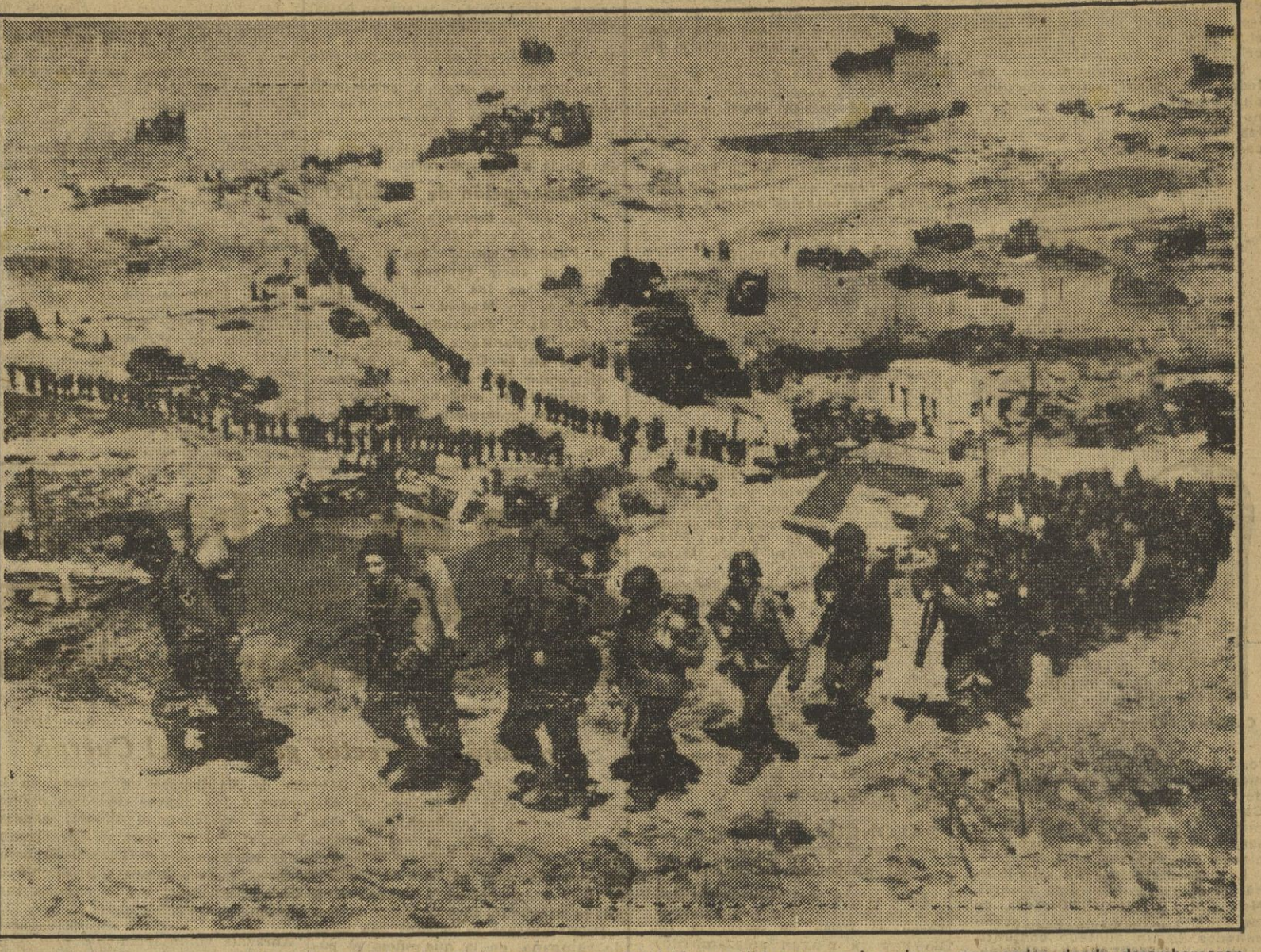
Interminables columnas de hombres y vehículos cargados con material bélico se internan en las playas normandas donde desembarcaron las tropas aliadas. La presente fotografía recoge un impresionante aspecto de la audaz operación.