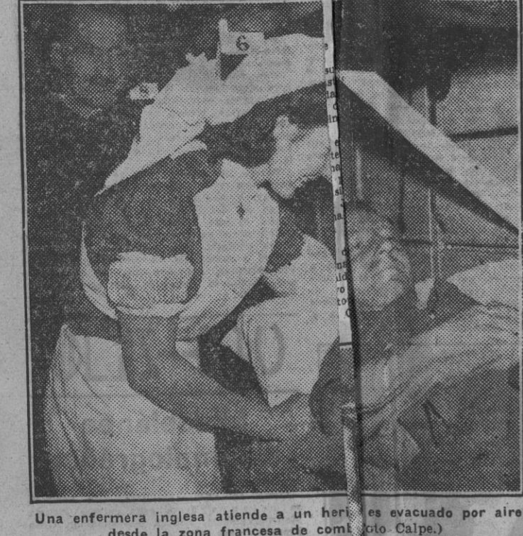
Una enfermera inglesa atiende a un herido que es evacuado por aire desde la zona francesa de combate de Calpe.