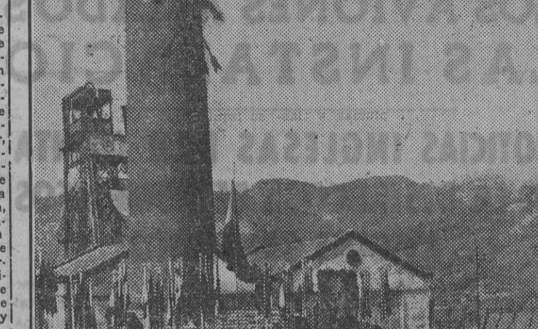
El ministro de Trabajo, camarada Girón, durante su brillante discurso ante los mineros asturianos.