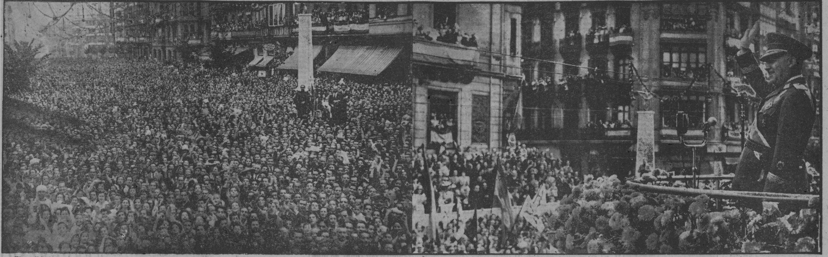
El recibimiento que la villa de Bilbao dispensó al Caudillo ha revestido caracteres de apoteosis. Una inmensa muchedumbre aclamó a Su Excelencia con un fervor y un entusiasmo insuperables. La brillantez del desfile de productores y de los demás actos en que intervino el Generalísimo quedó acreditada por la alegría y el clamor con que el pueblo de Vizcaya aplaudió y vitoreó, sin descanso, a Franco.

Año V.—Núm. 1.225 Madrid, martes 20 de junio de 1944 (III) Redacción y Administración, Narváez, 70. Teléfono 62600 Precio, 25 céntimos.