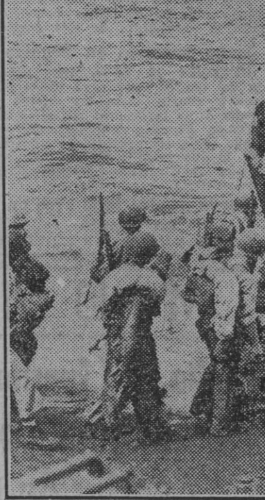
Soldados de Infantería de Marina norteamericana subiendo a las barcas de desembarco.

BILBAO, 18.—En la última sesión de la semana se registra en Bancos un retroceso de cuatro enteros para el Español de Crédito, y ganancias de uno para el Bilbao; Vizcaya B repite cambios. En Ferros, Vascongados A, Robla y Vascongados B mejoran 10, 20 y 25 pesetas. En Eléctrica, Hidrota repite cambios, mientras la Eléctrica y Duro ordinarios descienden dos y seis enteros. Unicamente se cotiza Sotolazar dominativa, con quebranto de cinco puntos en el sector minero. Mercado sostenido en Naviera, repitiendo las cuatro cotizadas. En Seguros, Aurora se apunta una nueva ganancia de 25 puntos. El sector Metalúrgico registra hoy mayor actividad que en días anteriores; Navatas preferentes y Hornos ganan dos enteros; la Naval, blanca, tres; Babosol Wilcox pierde otros tres, y Baconia, Auxiliar de Ferrocarriles y el Material Industrial no sufren variación. En Industrias, Papelera desciende dos enteros, Explosivos gana un punto y Reñera repite cambio.