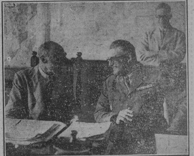
Lord Swinto (Izquierda), hablando con M. Courmaria, gobernador general del Africa Oriental Francesa, durante una conferencia en la Costa de Oro.