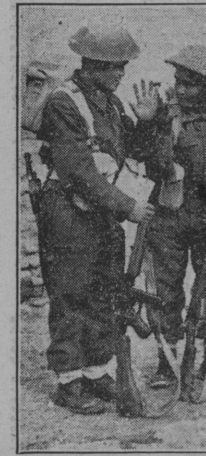
Tres soldados indios de una patrulla de exploración conversan antes de emprender la misión que les ha sido asignada en un lugar del frente italiano.

De conformidad con el artículo 15 de sus Estatutos, convoca a junta general ordinaria de accionistas para el día 28 del presente mes de febrero, a las doce horas, en su domicilio social, Juan Montalvo, 33, con objeto de someter a su examen y aprobación la Memoria y balance del ejercicio 1943.—Madrid, 17 febrero 1944.—El director-gerente.