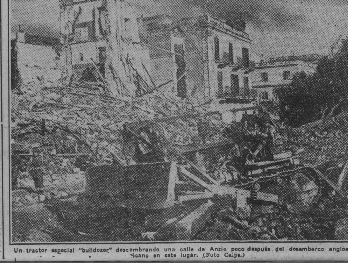
Un tractor especial "bulldozer" desmontando una calle de Anzio poco después del desembarco angloamericano en este lugar.