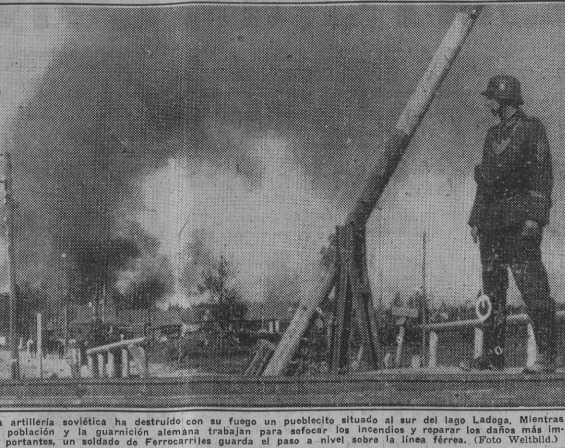
La artillería soviética ha destruido con su fuego un pueblito situado al sur del lago Ladoga...