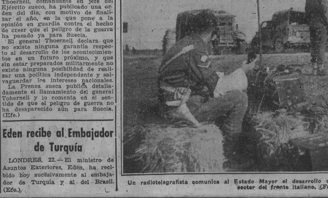
Un radiotelegrafista comunica al Estado Mayor el desarrollo del avance de las fuerzas británicas en un sector del frente italiano.