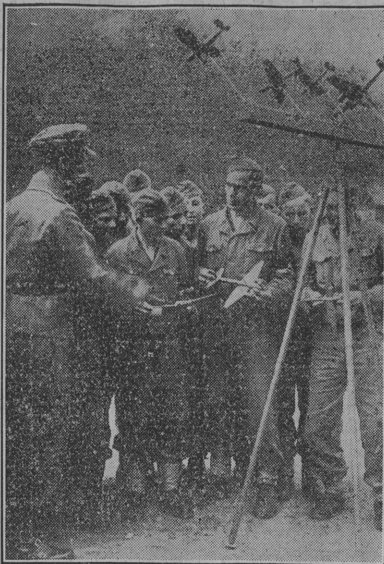
Un grupo de muchachos de las organizaciones juveniles alemanas dedican gran atención a la clase de prácticas de aerobismo.