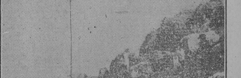
Soldados alemanos del Cuerpo de Transmisiones mantienen una estrecha y continua vigilancia para comunicar al Mando cualquier anomalía observada en el mar y en el aire.