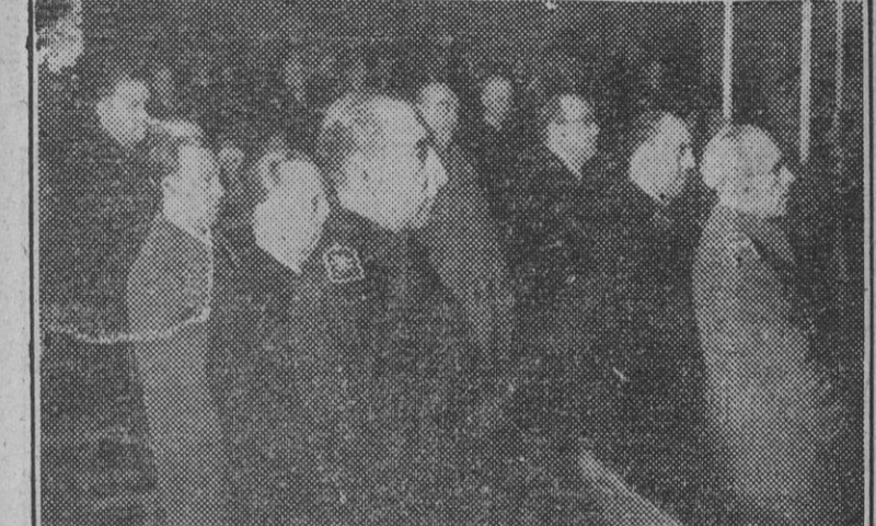
Los ministros del Ejército, Marina y Educación Nacional y la Mesa de las Cortes, presidiendo. Estaban Bilbao, con otras muchas altas autoridades y jerarcas, asistieron esta mañana a la sesión de sufragio de los procuradores fallecidos.