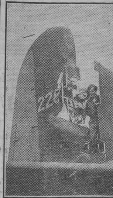
Al regresar a su base, un aviador muestra las averías causadas en la cola a la Forteza Volante, no obstante las cuales pudo continuar el vuelo.