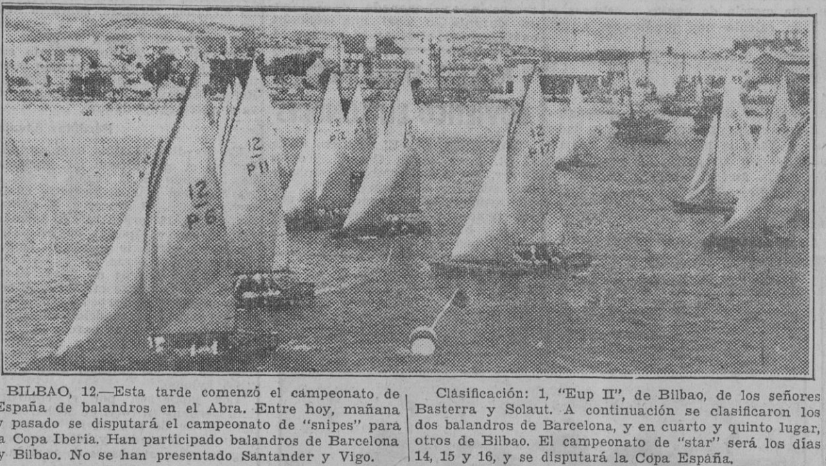
BILBAO, 12.—Esta tarde comenzó el campeonato de España de balanderos en el Abra. Entre hoy, mañana y pasado se disputará el campeonato de "snipes" para la Copa Iberia. Han participado balanderos de Barcelona y Bilbao. No se han presentado Santander y Vigo.