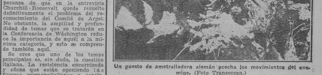
Un puesto de ametralladora alemán gecea los movimientos del enemigo.