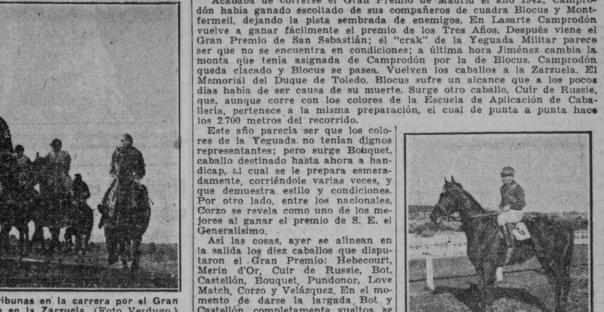
El pelotón pasa por delante de las tribunas en la carrera por el Gran Premio de Madrid, corrida ayer tarde en la Zarzuela.