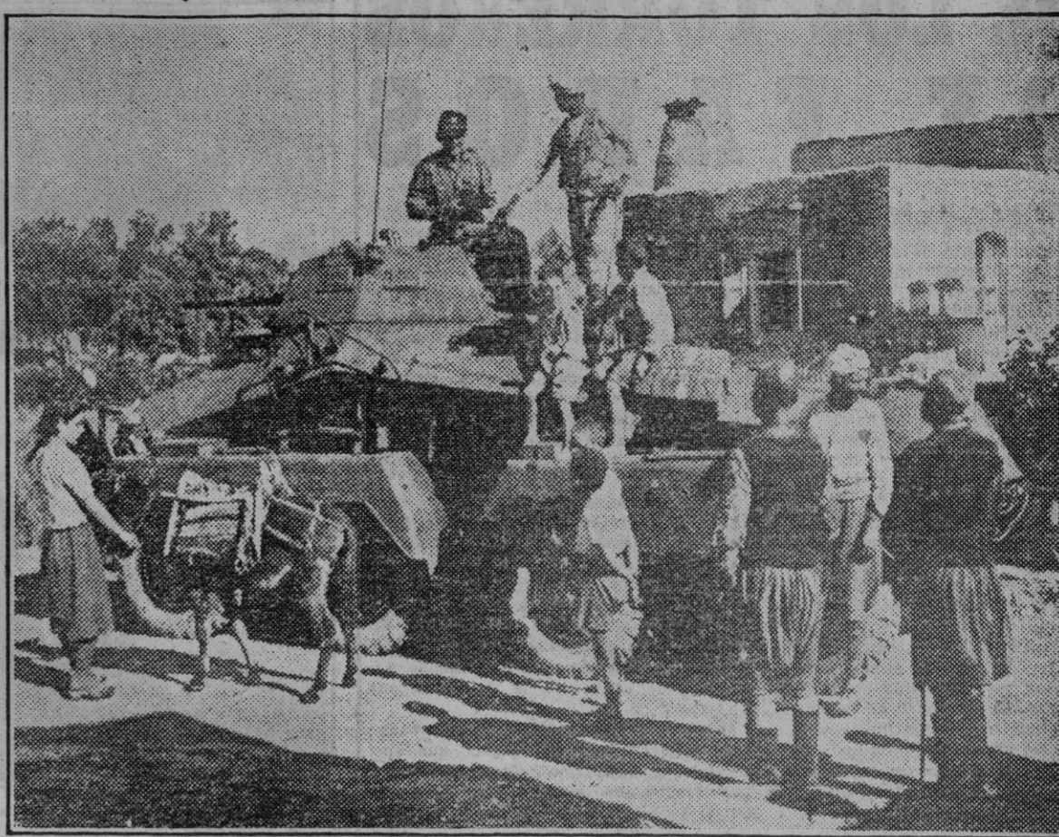
En una calle de Creta se detiene un tanque explorador. Es un acontecimiento para los habitantes, que asisten al espectáculo con curiosidad, mientras los niños asaltan el blindaje.