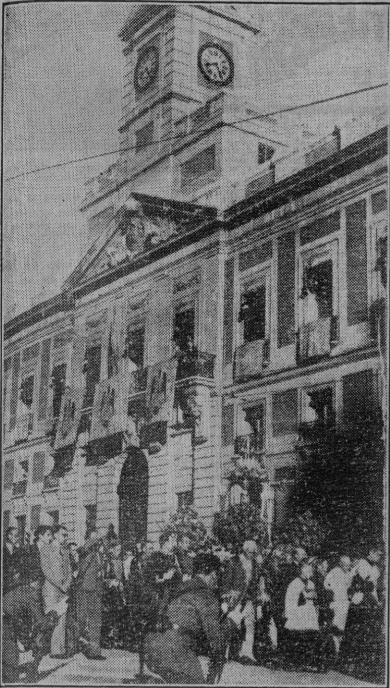
La procesión del Corpus desfila por la Puerta del Sol, donde se congregaron miles de personas para presenciar su paso.