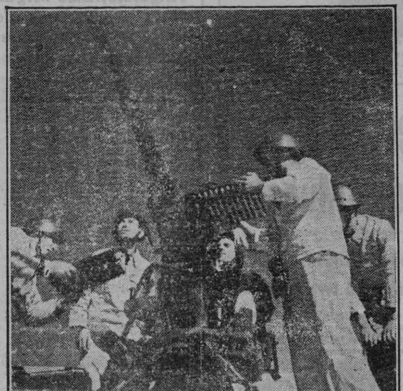
moderno sistema de recambio de ánimas—infinitamente superior a la de los cañones; aquellas son máquinas que se anticipan mucho menos rápidamente que éstas, y por último, es mucho más factible para la mayor parte de los países fabricar proyectiles que procurarse gasolina.

Hasta aquí el cañón A. A. en su misión específica. Pero sucede que además es un arma anticarro poderosa y que es de eficacia suma en el apoyo de la infantería. Por otro lado, el personal para su manejo no necesita una especialización tan depurada como el volante; la vida de las piezas A. A. es—con el