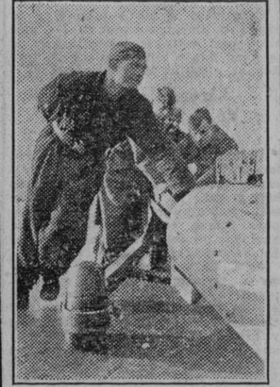
Bomba pesada en el momento de ser transportada a un avión de bombardeo alemán en un campo de aterrizaje en el norte de Francia. (Foto Transocean.)

Española recibieron la comunión Pascual. Pronunció un sermón, en esta ceremonia, el obispo de Salinas. Asistió el embajador de España. (Efe.)