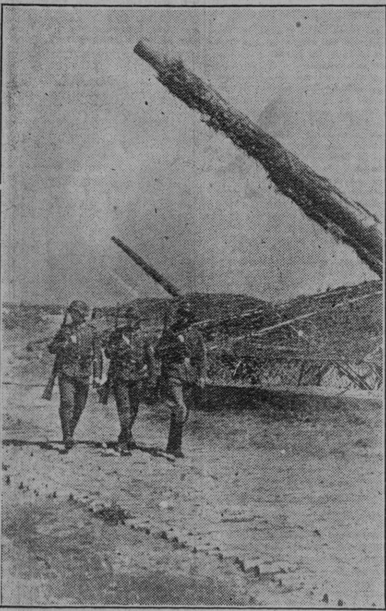
Alemania artillos las costas de los países ocupados del Oeste. He aquí varios cañones de largo alcance que dirigen sus bocas hacia la otra orilla del Canal de la Mancha.