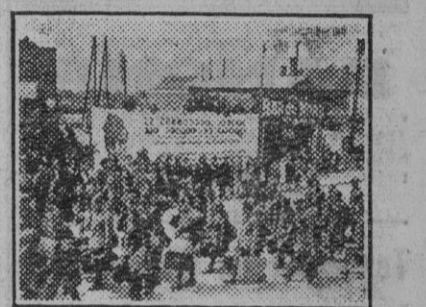
Prisioneros franceses que regresan a su patria después de haber sido canjeados por alemanes que fueron hechos prisioneros por los franceses que regresan a Alemania.