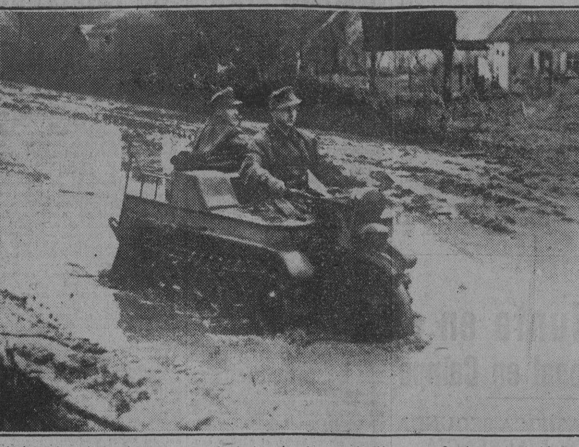
El invierno hace impracticables la mayoría de las vías de comunicación rusas. Gracias a los vehículos habilitados especialmente para estas condiciones por los técnicos alemanes, el Eje logra abrirse camino por este mar de barro. En la fotografía, una motocicleta-oruga conducida por soldados del Eje.