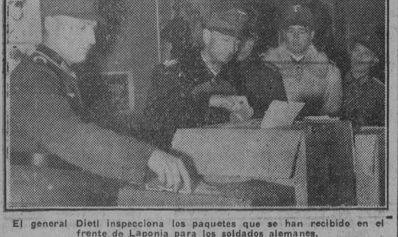
El general Dietl inspecciona los paquetes que se han recibido en el frente de Laponia para los soldados alemanes.