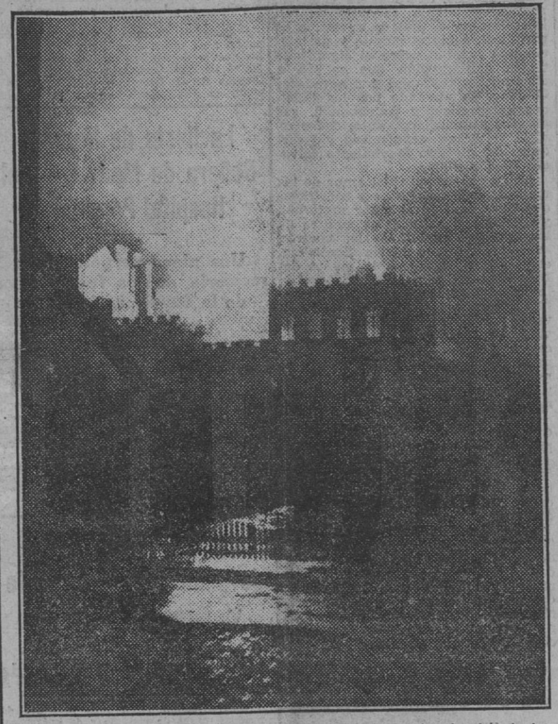
Aspecto nocturno de la ciudad de York durante un bombardeo de los aviones alemanes.