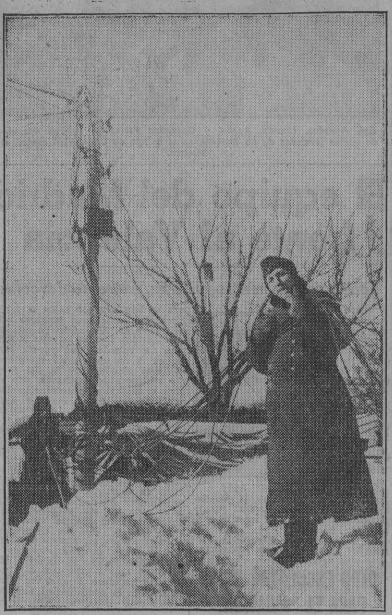
Soldados alemanes de Transmisiones tienden una red telefónica en el frente ruso, ya blanqueado por las primeras nevadas del invierno.