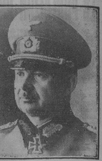
El nuevo jefe del Alto Estado Mayor del Ejército alemán, General Zeitzler.