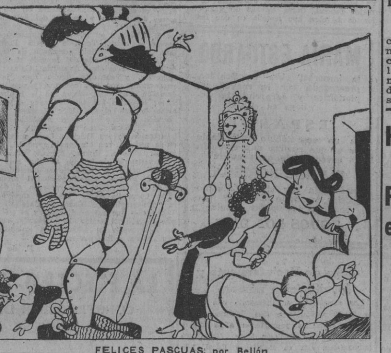
FELICES PASCUAS, por Bellón. EL PAVO.—Veremos si me salva este refugio blindado!