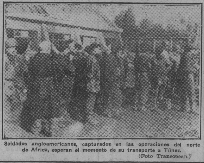
Soldados angloamericanos, capturados en las operaciones del norte de África...