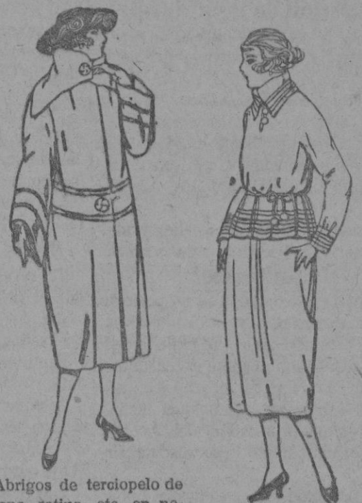
Abrigos de terciopelo de lana, ratina, etc., en negro, azul y color, adornos pespuntos seda. de ptas. 110 a 200

ROPAS CONFECCIONADAS PARA CABALLERO, SEÑORA, NIÑO Y NIÑA