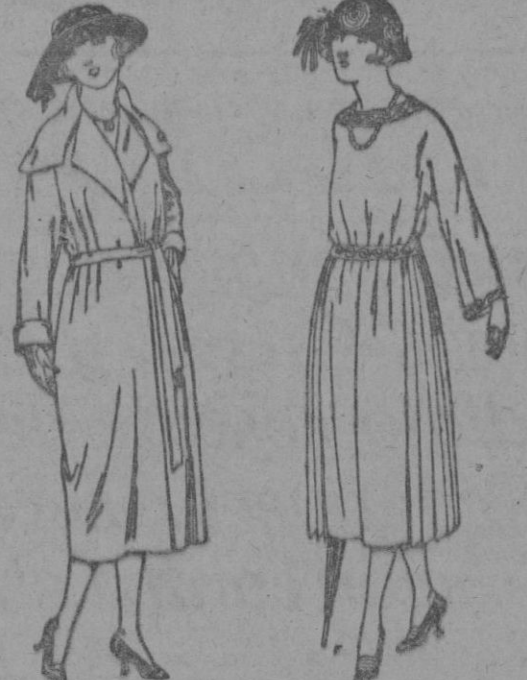
Abrigos de gamuza, cheviot, etc., en negro, azul y color. de ptas. 50 a 100