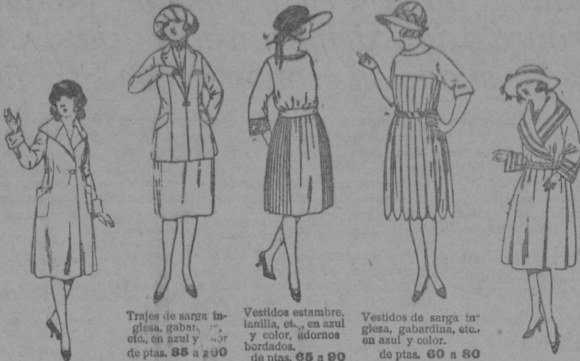
Trajes de sarga inglesa, gabardina, etc., en azul y color, adornos bordados. de ptas. 85 a 200