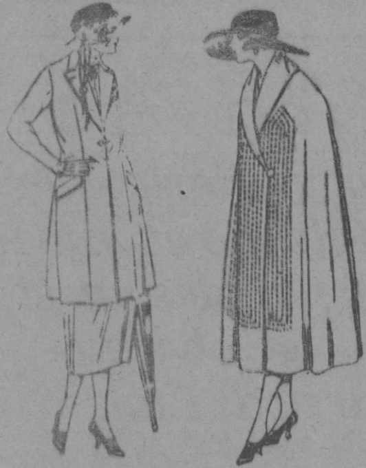
Trajes de sarga inglesa, cheviot, en negro, azul y color. de ptas. 140 a 200

SUCURSALES: Madrid, Barcelona, Alicante, Almería, Bilbao, Cádiz, Cartagena, Gijón, Granada, Málaga, Santander, Sevilla, Valencia, Valladolid, Zaragoza