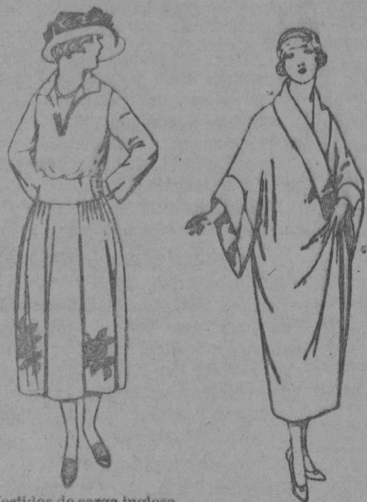
Vestidos de sarga inglesa, estambre, etc., en negro, azul y color, adornos bordados a mano. de ptas. 100 a 140