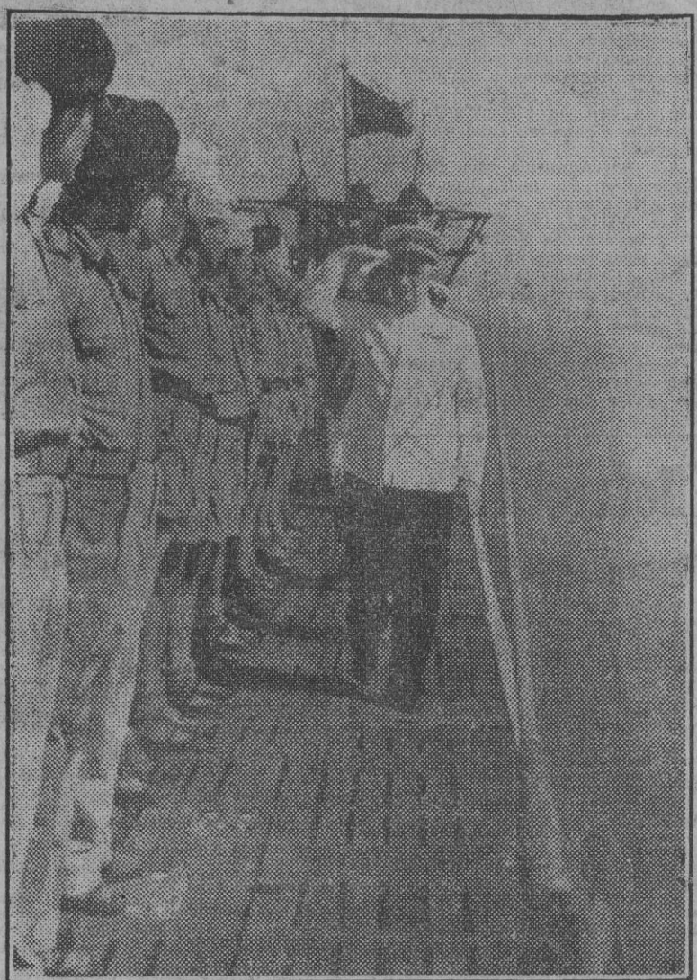
A la llegada a Taranto del primer submarino alemán, un almirante italiano pasa revista a la tripulación.