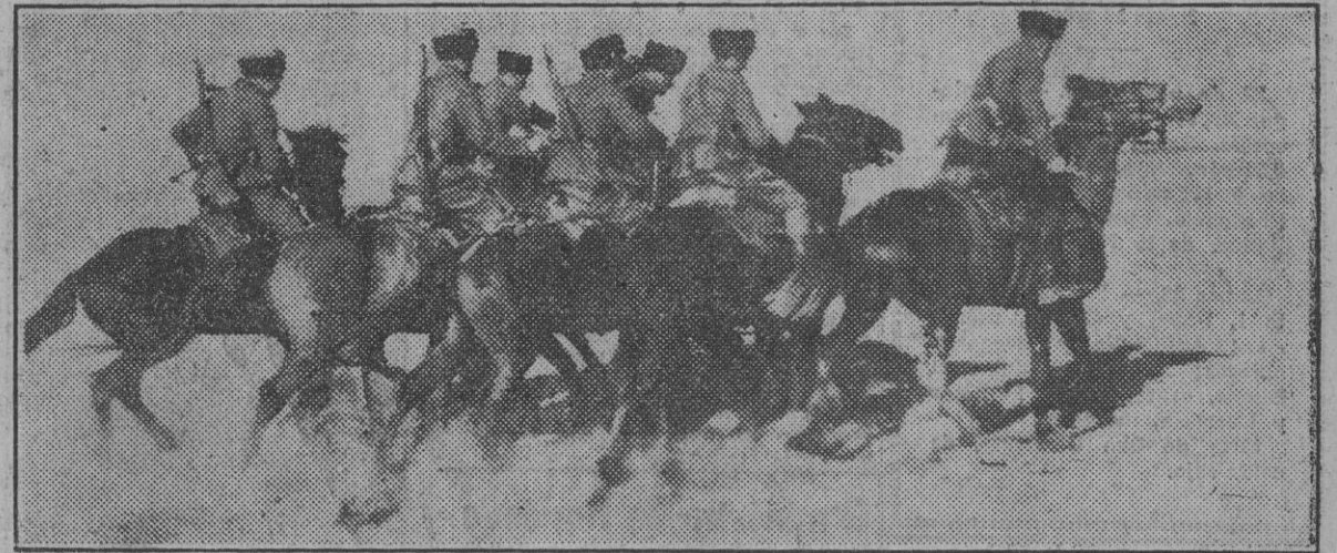
Una sección de cosacos, al servicio de las tropas alemanas, galopando por la estepa rusa.