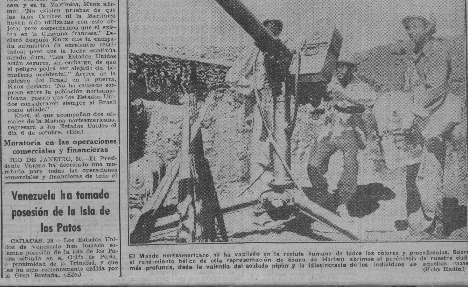
El Mando norteamericano no ha vacilado en la recluta humana de todos los colores y procedencias. Sobre el rendimiento bélico de esta representación de ébano de Harlem abrimos el paréntesis de nuestra duda más profunda, dada la valentía del soldado nipón y la idiosincracia de los individuos de aquél.