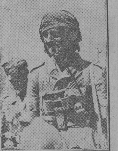
No sólo en el desierto africano, sino sobre la zona esteparia caucásica, los soldados alemanos tienen que resistir los extremados rigores del clima de las inhóspitas regiones que conquistaron.