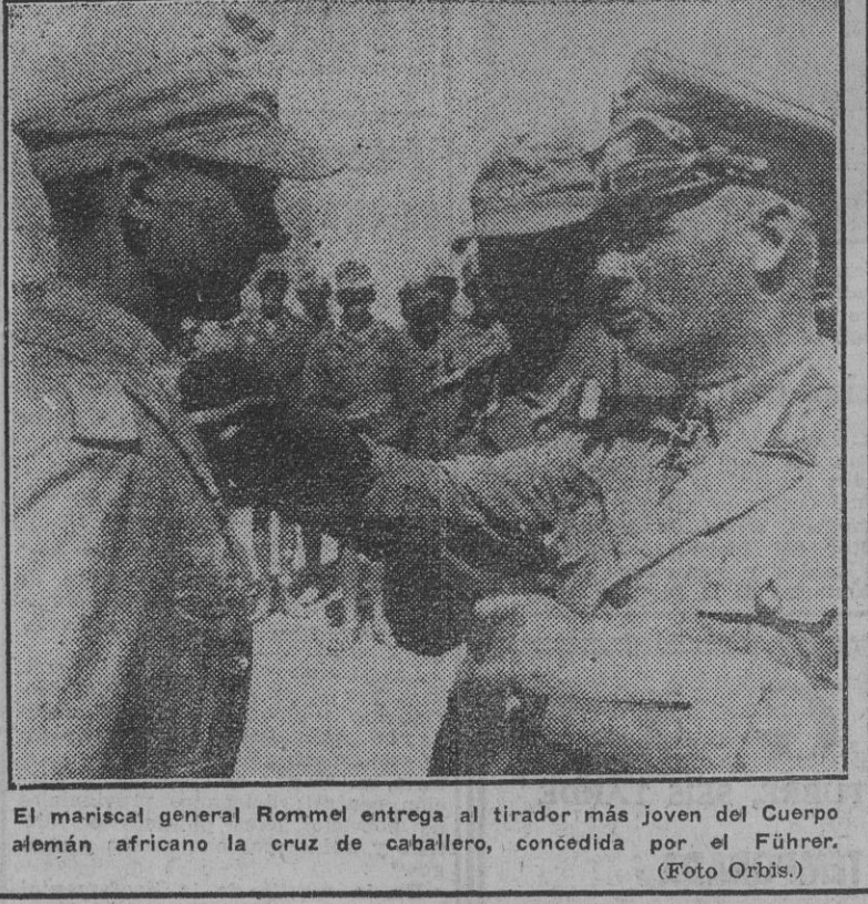
El mariscal general Rommel entrega al tirador más joven del Cuerno alemán africano la cruz de caballero, concedida por el Führer.