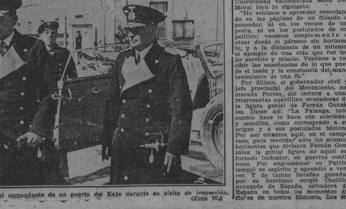
El general-almirante Kapls saluda al comandante de un puerto del Eje durante su visita de inspección.