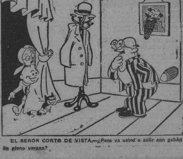
EL SEÑOR CORTO DE VISTA. ¿Pasa va usted a salir, con gabán en pleno verano?