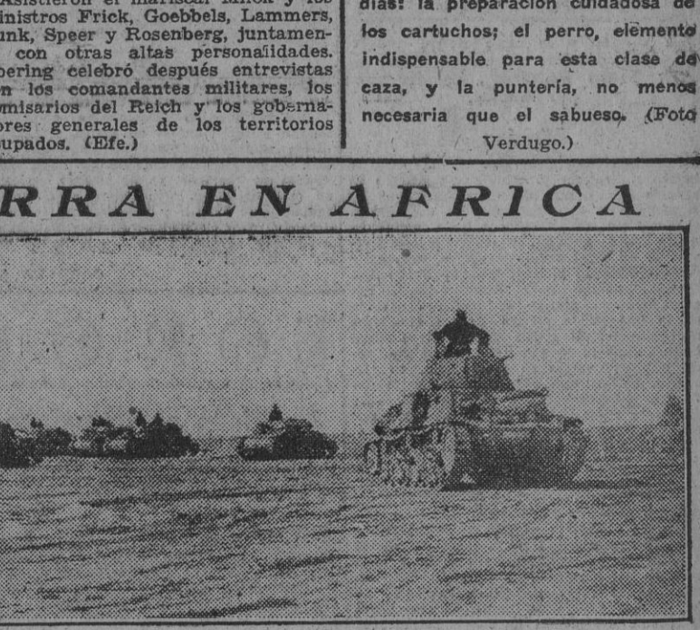
Numerosas formaciones italianas avanzan, en tanques, por territorio egipcio.