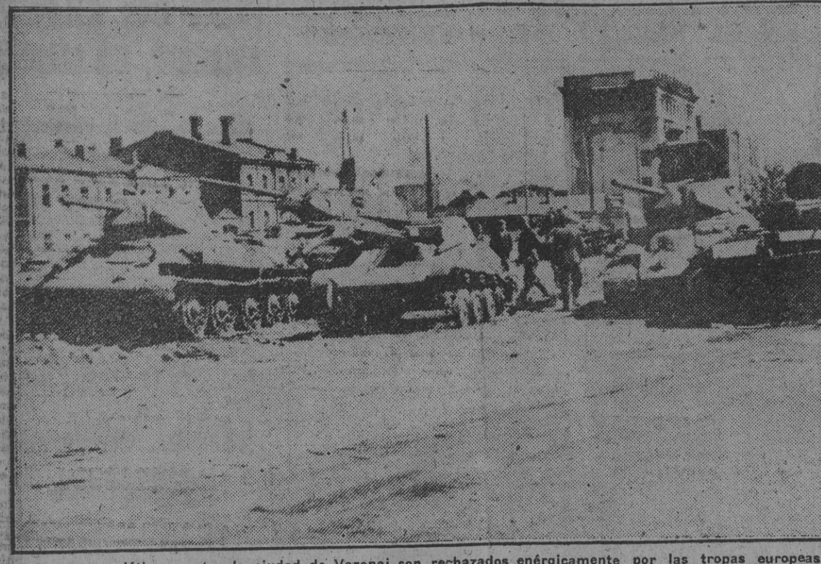
Los ataques soviéticos contra la ciudad de Voronej son rechazados energicamente por las tropas europeas que defienden aquel sector. En el último intento de los rusos contra la importante ciudad perdieron estos gran cantidad de tanques y material de guerra. En las calles se ven abandonados los carros de asalto y los poderosos tanques, en los que las tropas rojas cifraban su esperanza para poder perforar la línea de resistencia europea.