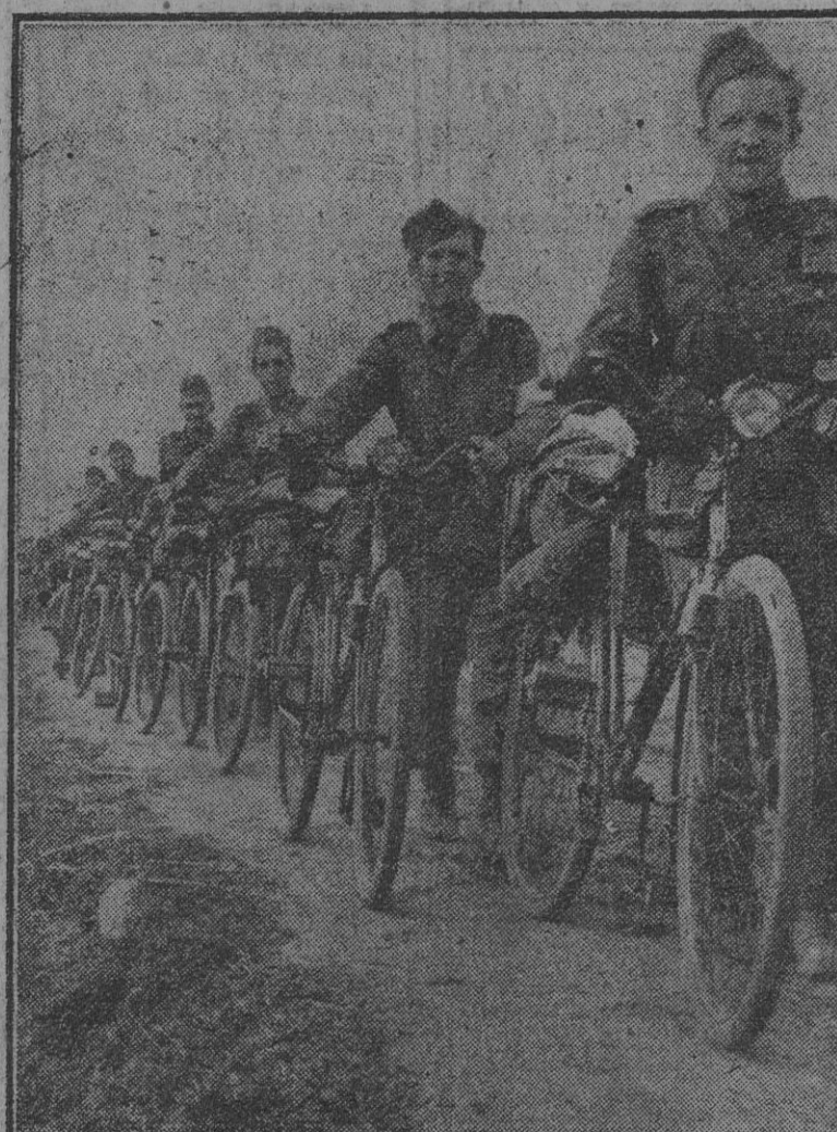
Los heroicos voluntarios de la División Azul llevan en su rostro el sello español, imborrable, de la alegría y la decisión unidas ante el combate contra las tropas soviéticas.

En la lucha contra la Gran Bretaña, las formaciones aéreas germanas han arrojado bombas explosivas pesadas y superpesadas contra las instalaciones portuarias e industriales de importancia militar de Hull. Estas operaciones se realizaron en la noche del 31 de julio al 1 de agosto. Todos los aviones que participaron en esta acción han regresado a su base. (Efe.)