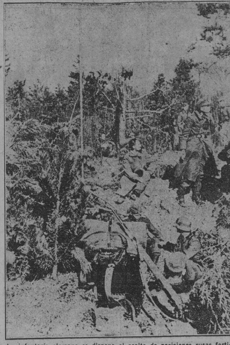
La infantería alemana se dispone al asalto de posiciones rusas fortificadas en el sector del Donet, donde las tropas de Timochenko han sufrido un duro revés.