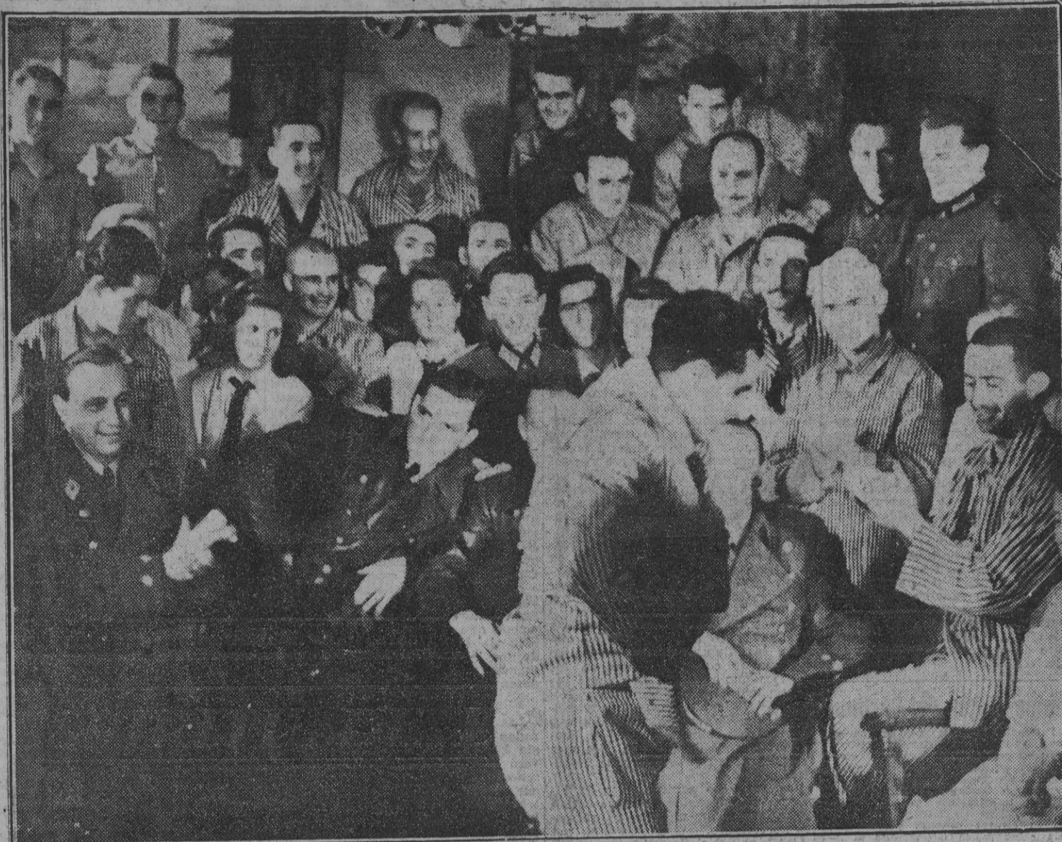
El brio espíritu de nuestros combatientes y el esmerado trato que reciben en el Hospital de Convalecientes han triunfado de las heridas causadas por el plomo soviético. Con asistencia de camaradas alemanes y miembros de las Juventudes Femeninas hitlerianas se ha organizado una reunión en la que los heridos son, a la vez, actores y espectadores. He aquí unas sevillanas interpretadas con todo el verismo que las heridas recién cicatrizadas pueden permitir.