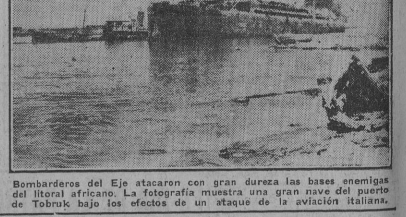
Bombarderos del Eje atacaron con gran dureza las bases enemigas del litoral africano. La fotografía muestra una gran nave de puerto de Tobruk bajo los efectos de un ataque de la aviación italiana.