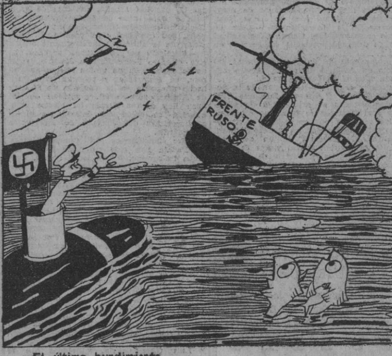
El último hundimiento.

"El asalto a la Bastilla fué obra de agentes ingleses"