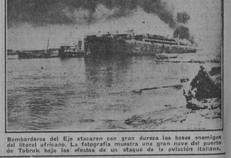
Bombarderos del Eje atacaron con gran dureza las bases enemigas del litoral africano. La fotografía muestra una gran nave de puerto de Tobruk bajo los efectos de un ataque de la aviación italiana.