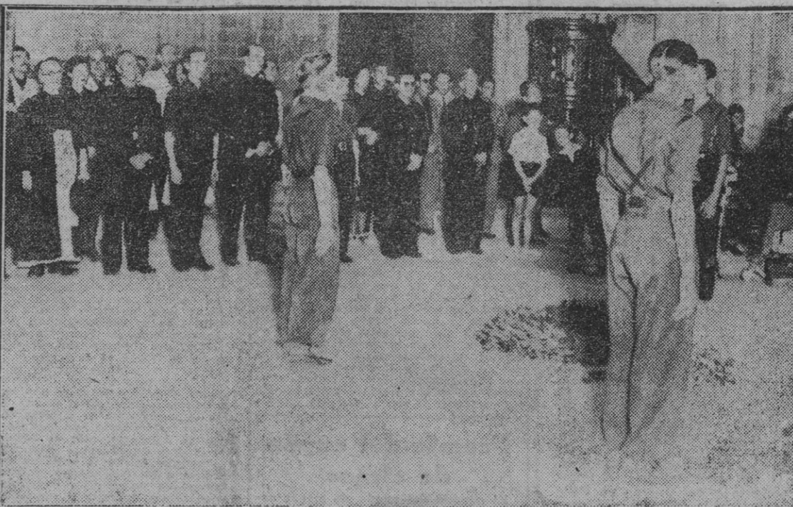
Los jefes provinciales de Artesanía, que asistieron al cursillo clausurado el sábado último, depositaron ayer por la mañana una corona de laurel en la tumba de José Antonio.