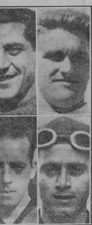
Escaladores de la etapa de ayer.