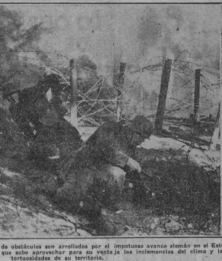
Alambradas, trincheras, toda clase de obstáculos son arrollados por el imponente avance alemán en el Este, luchando contra un enemigo feroz que sabe aprovechar para su ventaja las inclemencias del clima y las torpezaduras de su territorio.