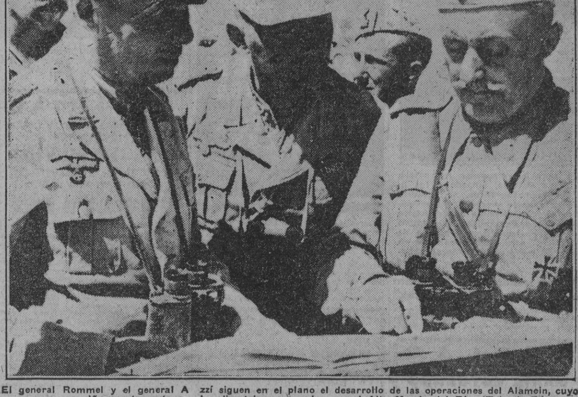
El general Rommel y el general Azzu siguen en el plano del desarrollo de las operaciones del Alamein, bajo las directrices marcadas por el Alto Mando del Eje.