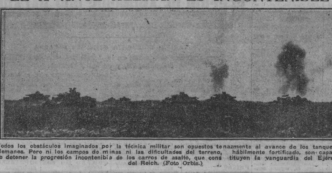
Todos los obstáculos imaginados por la técnica militar son opuestos tenazmente al avance de los tanques alemanes. Pero ni las dificultades del terreno, hábilmente fortificado, ni capaces de detener la progresión incontestable de los carros de asalto, que constituyen la vanguardia del Ejército del Reich.

El Departamento de Marina confirma la pérdida de cinco mercantes