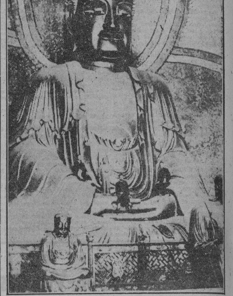
Gigantesca estatua de Buda erigida en la ciudad de Sing Tchang, de la provincia de Cheking, ocupada recientemente por las armas japonesas. En sus manos gigantescas se han colocado dos hombres y otro sobre un brazo, cosa lo que se aprecia el enorme tamaño de la imagen.