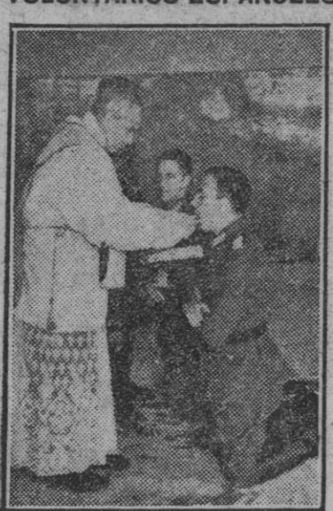
Los heroicos combatientes de la División Azul cumplen sus deberes de buenos católicos. Siempre han caracterizado al soldado español el valor temerario para cualquier hazaña bélica al servicio de la Patria y la humilde disposición de espíritu para el servicio de Dios.