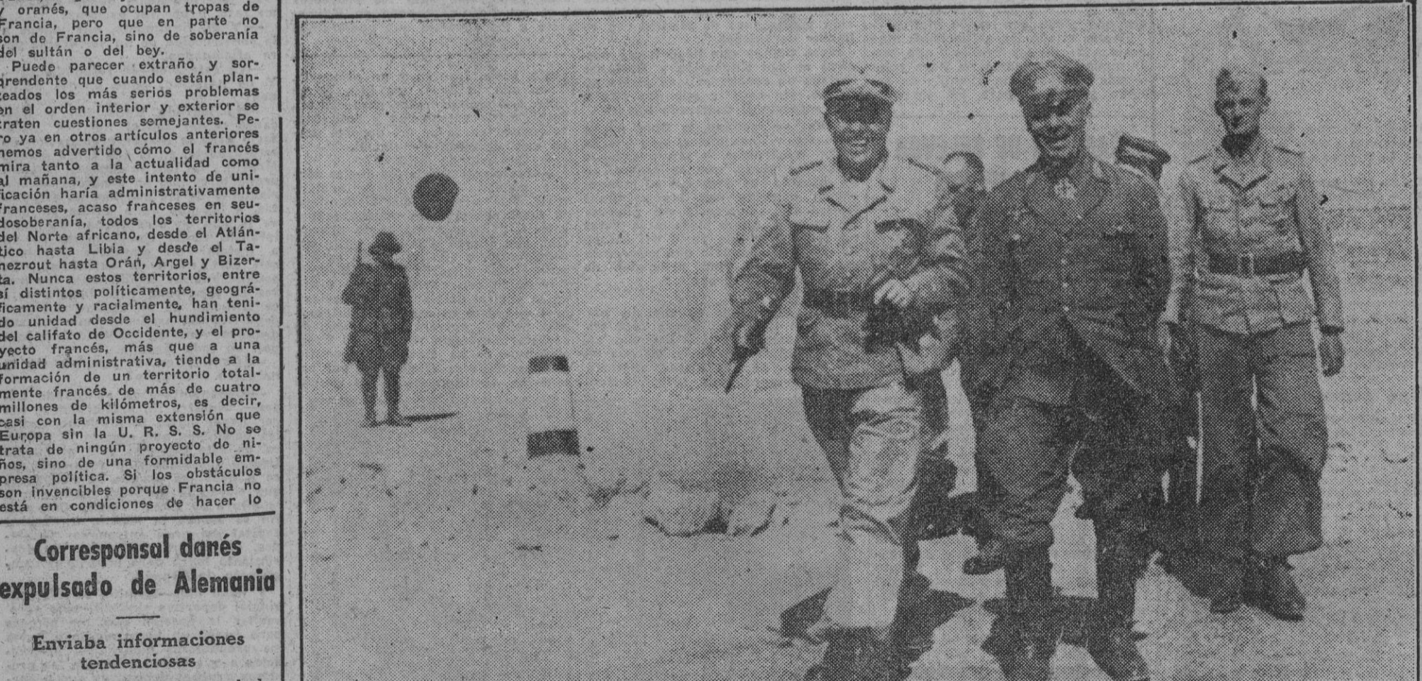
Los mariscales generales de campo Kesselring y Rommel después de una extensa conferencia sobre las operaciones victoriosas que las tropas germano-italianas llevan a cabo en el septentrional Egipto. La resistencia británica, concentrada en las posiciones del Alamein, ha sufrido rudos golpes de las fuerzas del Eje.