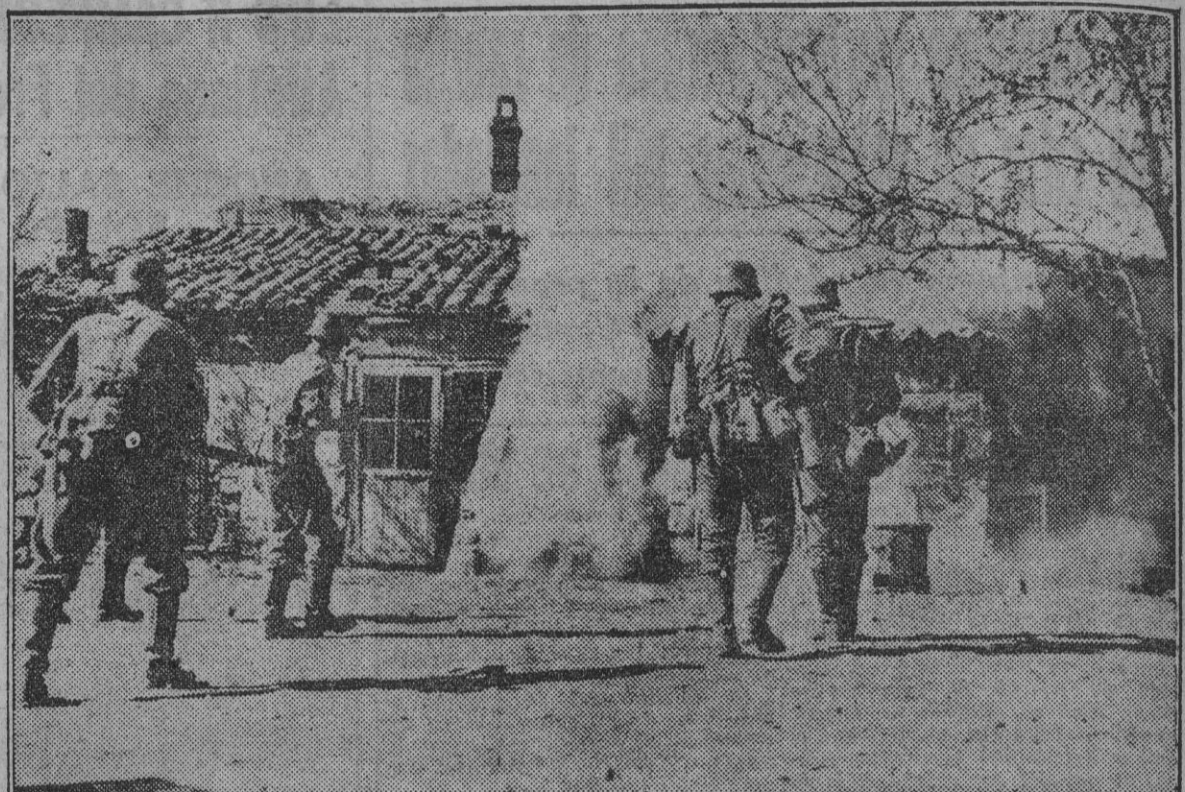
Con las armas preparadas estos soldados alemanes aguardan la salida de algunos rusos que se habían hecho fuertes en la casa, obligados después a rendirse para no perder carbonizados por las llamas que consumen el edificio.