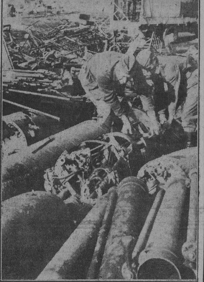
Es tan copioso el botín cogido en todos los frentes por las tropas del Eje, que las operaciones de recuento exigen tiempo y personal en proporciones pocas veces conocidas.