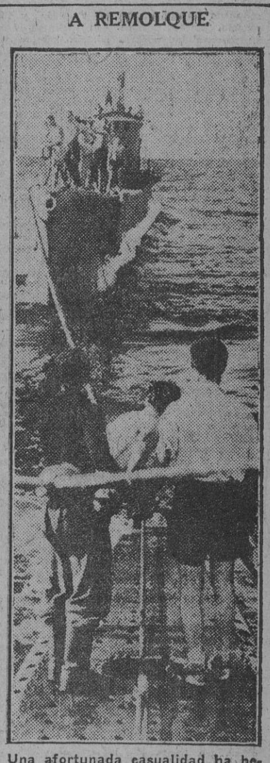
Una afortunada casualidad ha hecho que un submarino alemán haya coincidido en aguas del Atlántico con una lancha rápida averiada, que ha sido llevada a remolque por el submarino. El tiempo preciso para ultimar la completa reparación de aquella. (Foto Orbis)

Moscú, de la que los bolcheviques disponen aún para efectuar su aprovisionamiento de petróleo y sus desplazamientos de tropas, ha de dar un gran rodeo por Stalingrado, Grjasi, Wor y Kozlov. Pero, además, esta vía, que pasa a unos cien kilómetros al noreste de Voronej, pudiera ser cortada en un próximo porvenir y, en tal caso, los rusos se verían obligados a dar la vuelta por Tambov. Las consecuencias del rápido éxito del ejército de Von Bock dependen ahora de la cantidad de unidades que disponga en el Don. De fuente soviética se estima que 200.000 alemanes han franqueado el río y se declara abiertamente que la situación es muy grave. Las tropas de Timochenko tratan ahora de evitar ser cercadas luchando en c a r n i z a d a m e n t e. (Efe.)