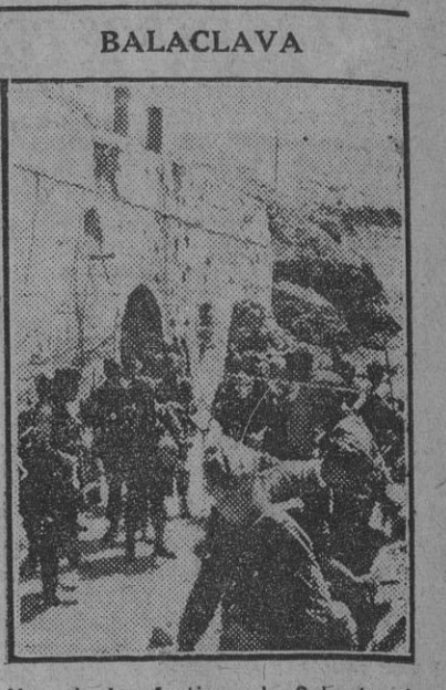
Uno de los fortines de Sevastopol donde se desarrolló una gran batalla de la guerra de Crimea en el siglo pasado. Los soldados alemanes descansan después de la reciente conquista de la plaza fuerte..

ROMA, 8.—Comunicado del Cuartel General de las fuerzas armadas italianas (número 771): "En el frente de Egipto fué rápidamente rechazado un violento ataque del enemigo, con sangrientas pérdidas para éste. El número de tanques y carros blindados del adversario destruidos en el curso de los combates de estos últimos días se eleva a 35. La cifra de prisioneros capturados es muy elevada. La aviación desarrolló gran actividad, y los aparatos del Eje tomaron parte principal en los combates terrestres y bombardeos, ametrallando columnas enemigas, originando numerosos incendios.