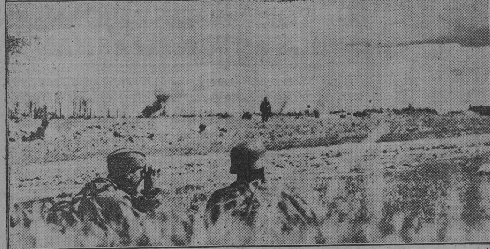
El impulso del primer ataque alemán, iniciador de la gran ofensiva del Este, hizo saltar las líneas avanzadas rusas. En la foto aparece un soldado soviético en llamas a consecuencia del duro combate que decidió su conquista por los soldados del Reich.