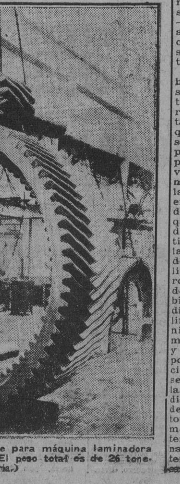
La foto muestra un gigantesco engranaje para máquina laminadora con corona forjada y piñones de acero. El peso total es de 26 toneladas.