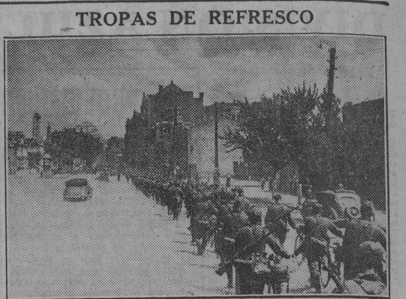
Mientras las divisiones de asalto amplían su avance a nuevas posiciones otras fuerzas de infantería se dirigen al frente para consolidar y guarnecer las líneas ocupadas al enemigo.

La ofensiva de Marmárica no ha impedido la recolección de la cosecha de trigo, fauna en la que los soldados italianos han ayudado a los colonos.