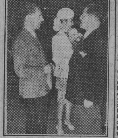
El doctor Goebbels, ministro de Propaganda del Reich, recibe al embajador nipón y a la señora de Oshima en el vestíbulo del Ufa-Palast, donde se celebró una representación del film "Alas niponas".