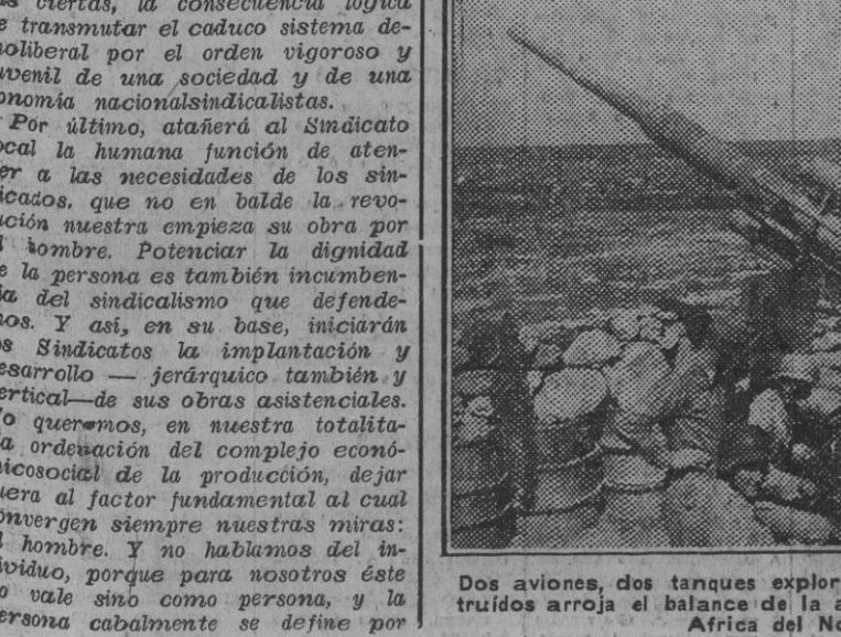
Los aviones, dos tanques exploradores y veinticinco de combate destruidos arroja el balance de la actuación de esta batería alemana en África del Norte.