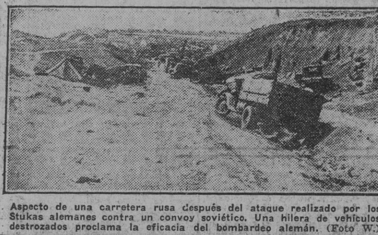
Aspecto de una carretera uná después del ataque realizado por los Stukas alemanes contra un convoy soviético. Una hilera de vehículos destruidos proclama la eficacia del bombardeo alemán.