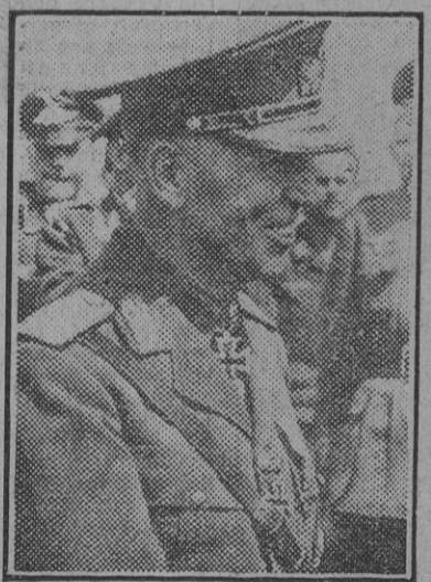
El mariscal Antonescu, Conductor rumano, que hoy celebra el 60 aniversario de su nacimiento.

Ion Antonescu nació en Pitesti en 1882. Ingresó en la Academia Militar de Craiova en 1902, y en el año 1904 obtuvo el grado de alférez. Intervino en la campaña de 1913 como capitán en la oficina de operaciones del Estado Mayor. Participa asimismo en la guerra europea en 1916 y colabora al final de la campaña con el general Prezon. En 1919, con el grado de teniente coronel, interviene en la marcha sobre Budapest para sofocar la revolución comunista de Bela Kun. En 1931, después de varios ascensos, es promovido a general. Ostenta diversos cargos militares y representa a su país en el Extranjero. Actualmente se encuentra al frente del Gobierno de su país como Conductor del pueblo rumano. Ha sido condecorado varias veces, y re-