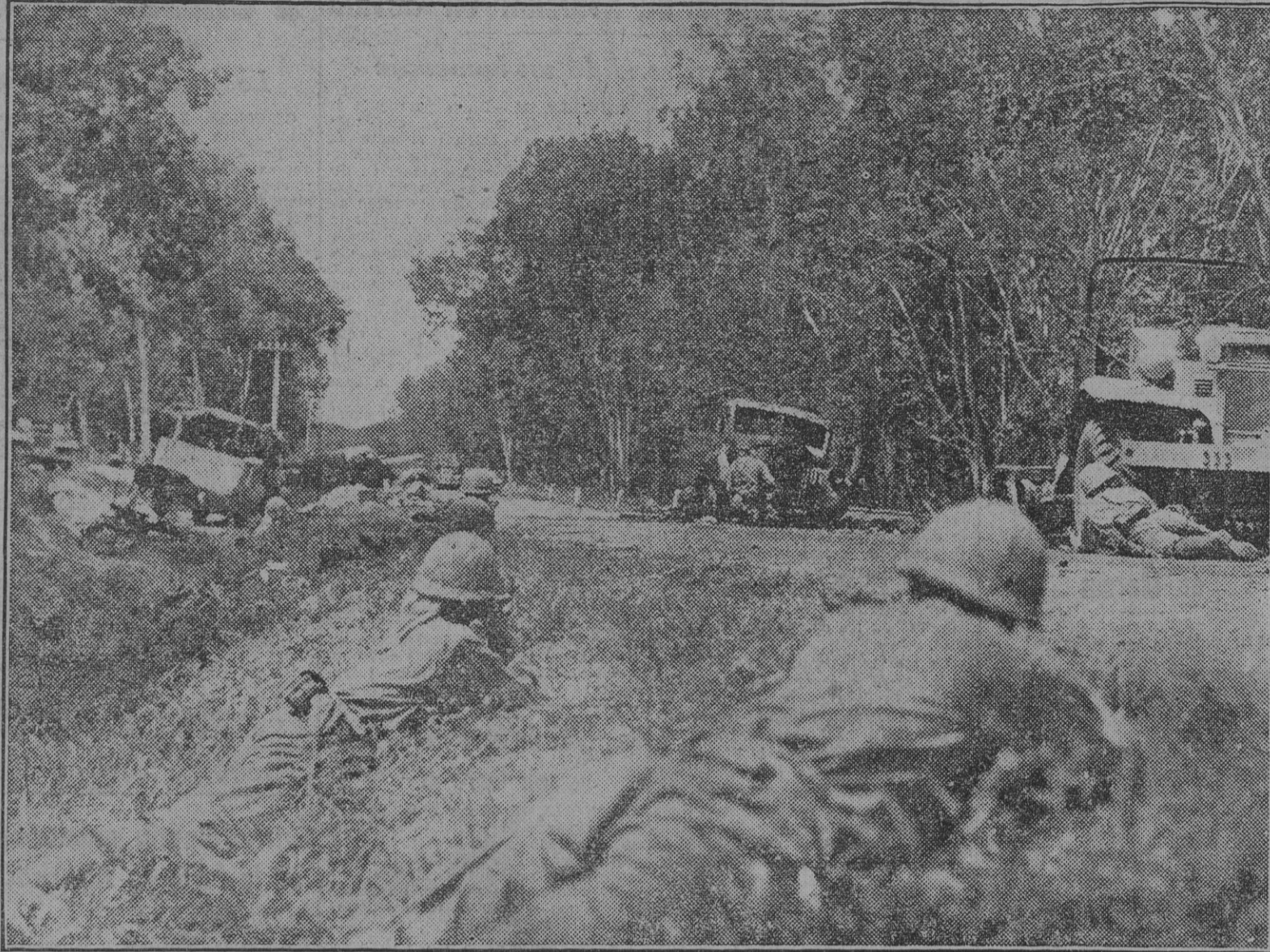
Las tropas japonesas de vanguardia han ocupado un importante nudo de comunicaciones en el sector de Unueu y sostienen implacablemente a los núcleos enemigos, asegurando el dominio de la carretera por la que se encauzará el avance de los elementos motorizados nipones.