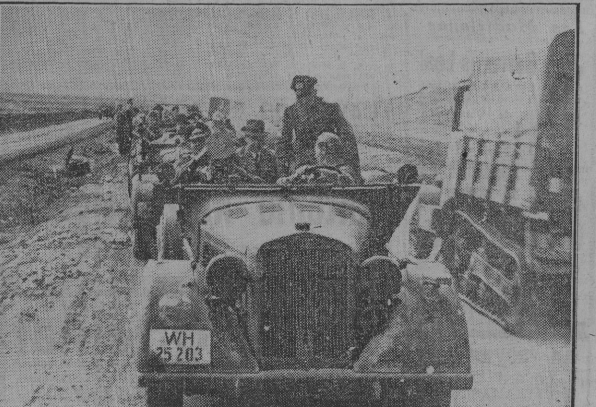
Periodistas de los países aliados y amigos del Reich visitan los campos de batalla de Kerch. La contemplación de las poderosas obras defensivas soviéticas y las explicaciones de los oficiales alemanes que les acompañan ofrecen a los representantes de la Prensa extranjera una cabal visión del esfuerzo gigantesco desplegado por las armas del Eje.