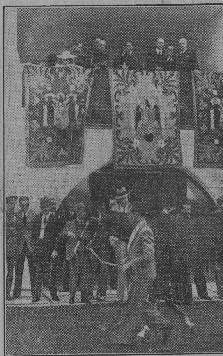
Su Excelencia el Jefe del Estado en el palacio presidencial del hipódromo de la Zarzuela, donde honró con su presencia la octava reunión hípica de primavera.

SU EXCELENCIA EL JEFE DEL ESTADO ASISTE A LAS CARRERAS DE CABALLOS