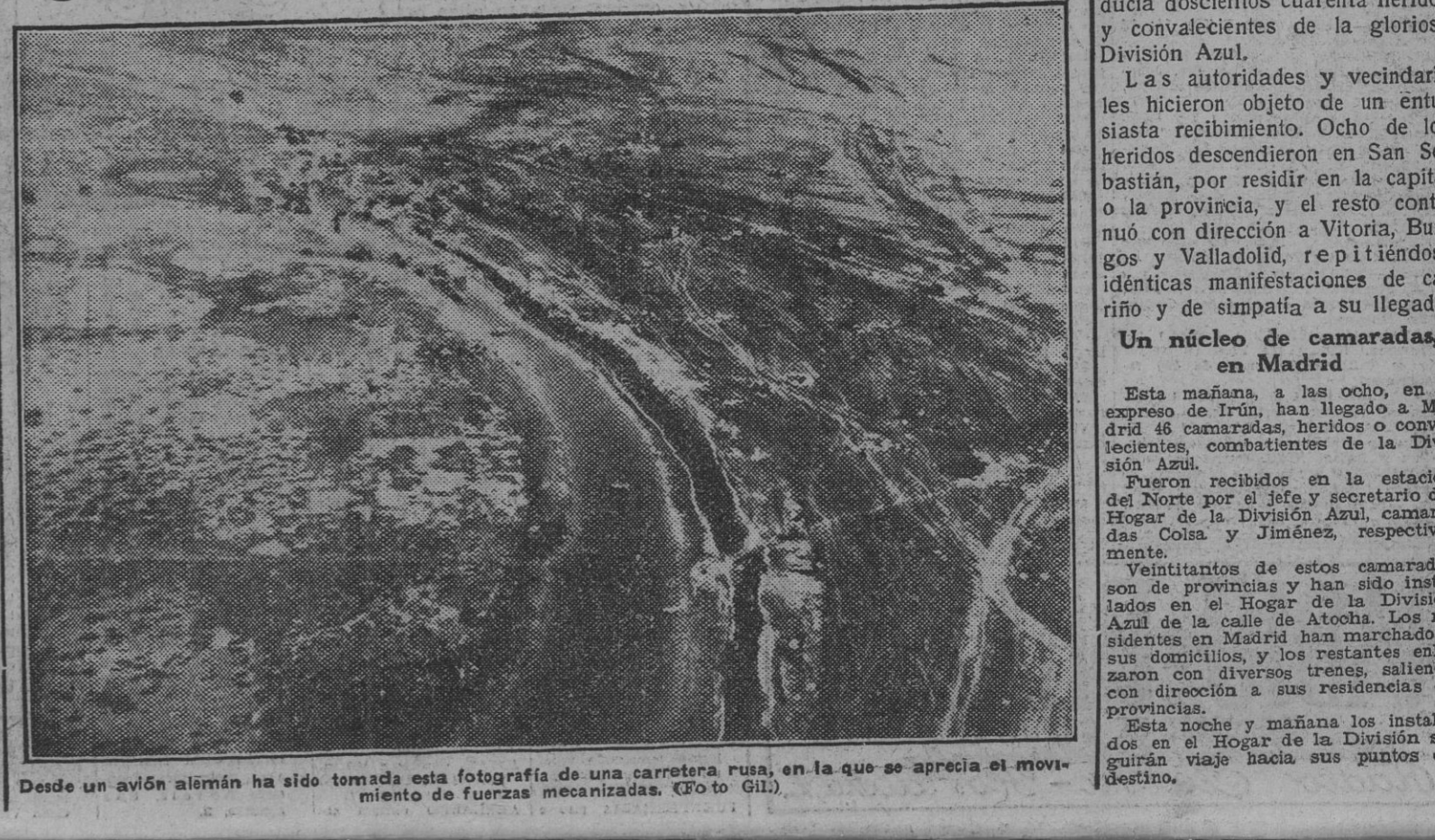
Desde un avión alemán ha sido tomada esta fotografía de una carretera rusa, en la que se aprecia el movimiento de fuerzas mecanizadas.