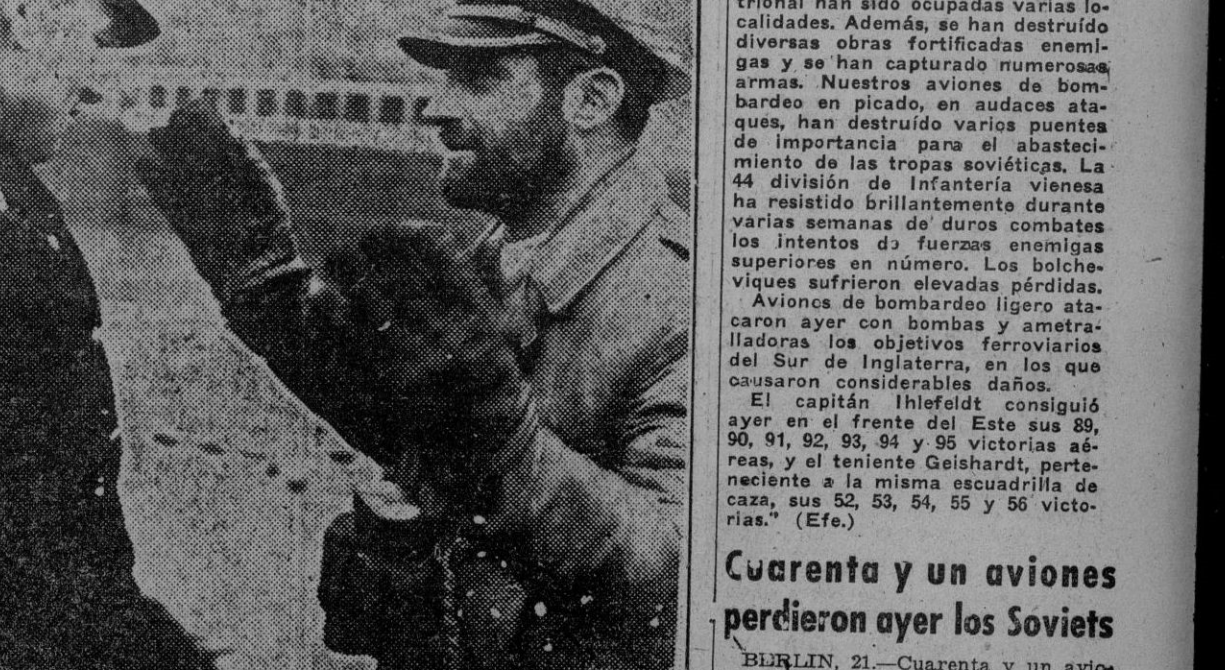
El comandante de un submarino alemán relata una de sus hazañas a su regreso de un crucero por los mares de Norteamérica.