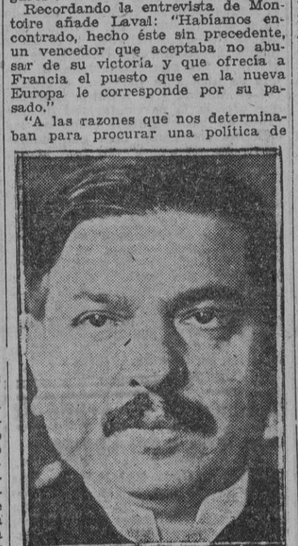
EL PRESIDENTE LAVAL

que el quisiera destruir lo que las operaciones militares respetaron", termina diciendo: "Si hay en este momento una primavera para la vida, la tierra de Francia, ¿por qué no habría de haberla también en la historia de nuestro país? Por nuestro amor y nuestra fe podremos todos sentir los esfuerzos hasta que el bienestar de Francia resida en el más alto de los Eilseos." El sucesor del jefe del Estado y actual comandante en jefe de las fuerzas armadas de Francia, almirante Darlan, fijará su residencia en París, en el Palacio del Eilseo, que anteriormente era residencia oficial del Presidente de la República. Laval, a París.