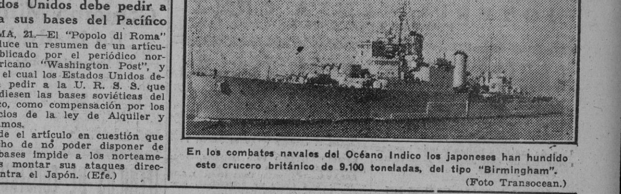
En los combates navales del Océano Índico los japoneses han hundido este crucero británico de 9.100 toneladas, del tipo “Birmingham”.