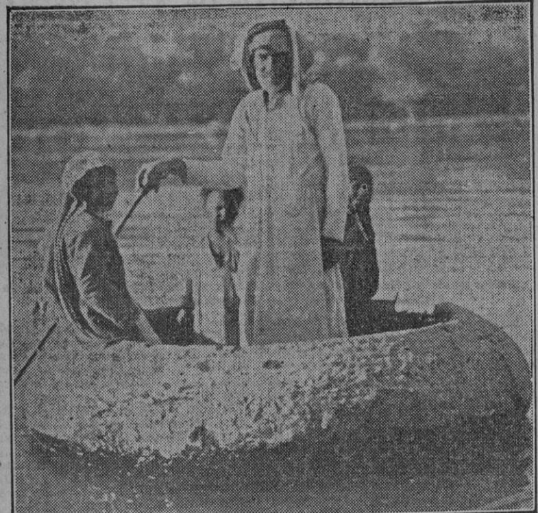
Una familia shria navega al modo antiguo en un barco típico, llamado "suffah", para atravesar el Euphrat.