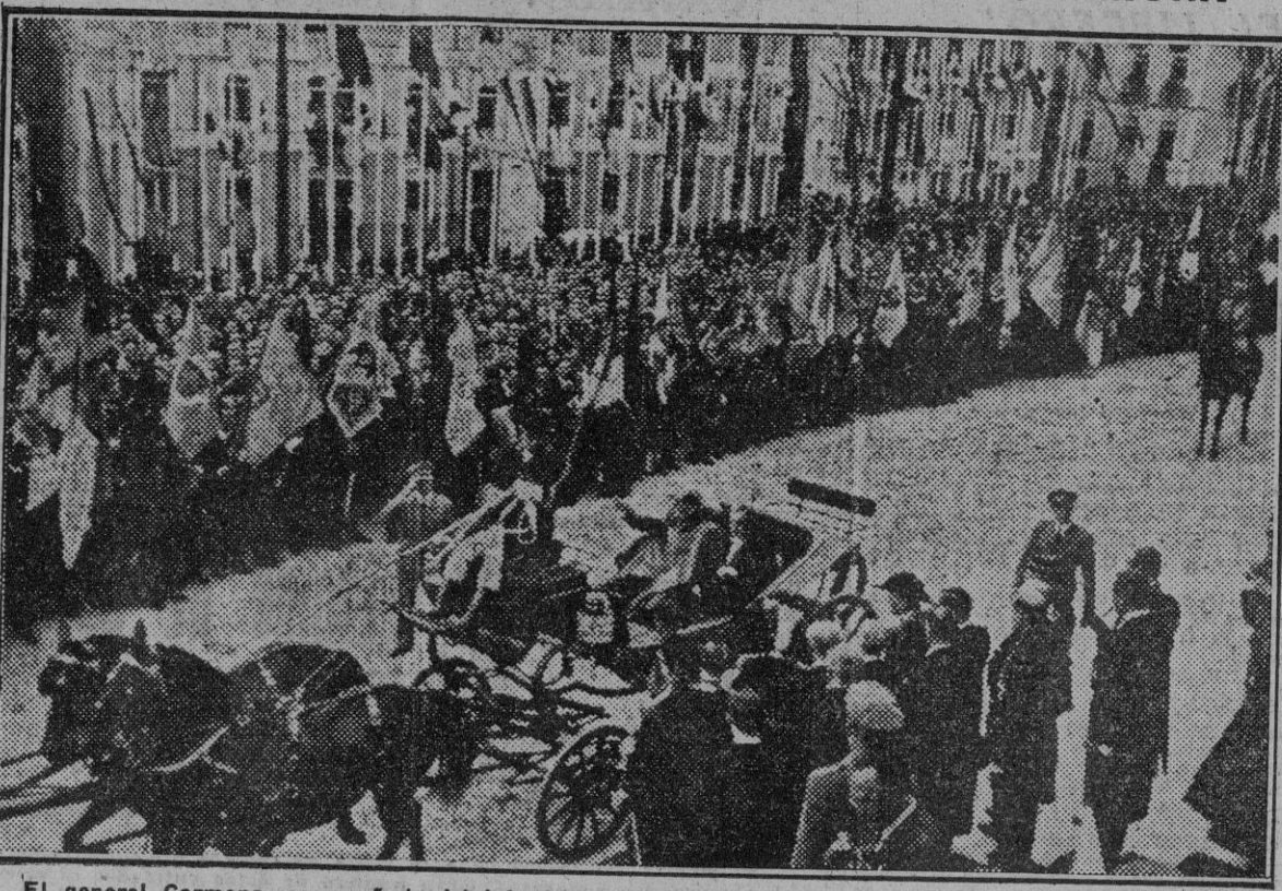
El general Carmona, acompañado del jefe del Gobierno portugués, doctor Oliveira Salazar, llega al Palacio de la Asamblea, en Lisboa, para renovar su juramento como Jefe del Estado.