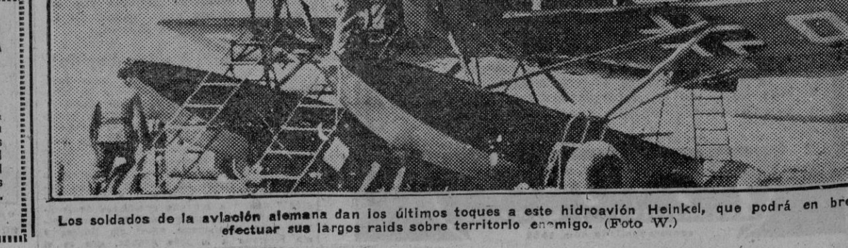
Los soldados de la aviación alemana dan los últimos toques a este hidroavión Heinkel, que podrá en breve efectuar sus largos raids sobre territorio enemigo.

BERLIN, 21.—Del comunicado alemán: "En África del Norte, una acción ofensiva emprendida por los elementos de reconocimiento británicos en la región de Ain-el-Gazala ha sido rechazada por nuestra artillería." Sobre la isla de Malta Imperio italiano, los aviones de la aviación italoalemana continúan lanzando ataques contra las instalaciones enemigas. En aguas de la isla y del Norte de África, los cazas alemanes han derribado a seis aviones británicos y han destruido a cinco en sus bases. (Efe.)