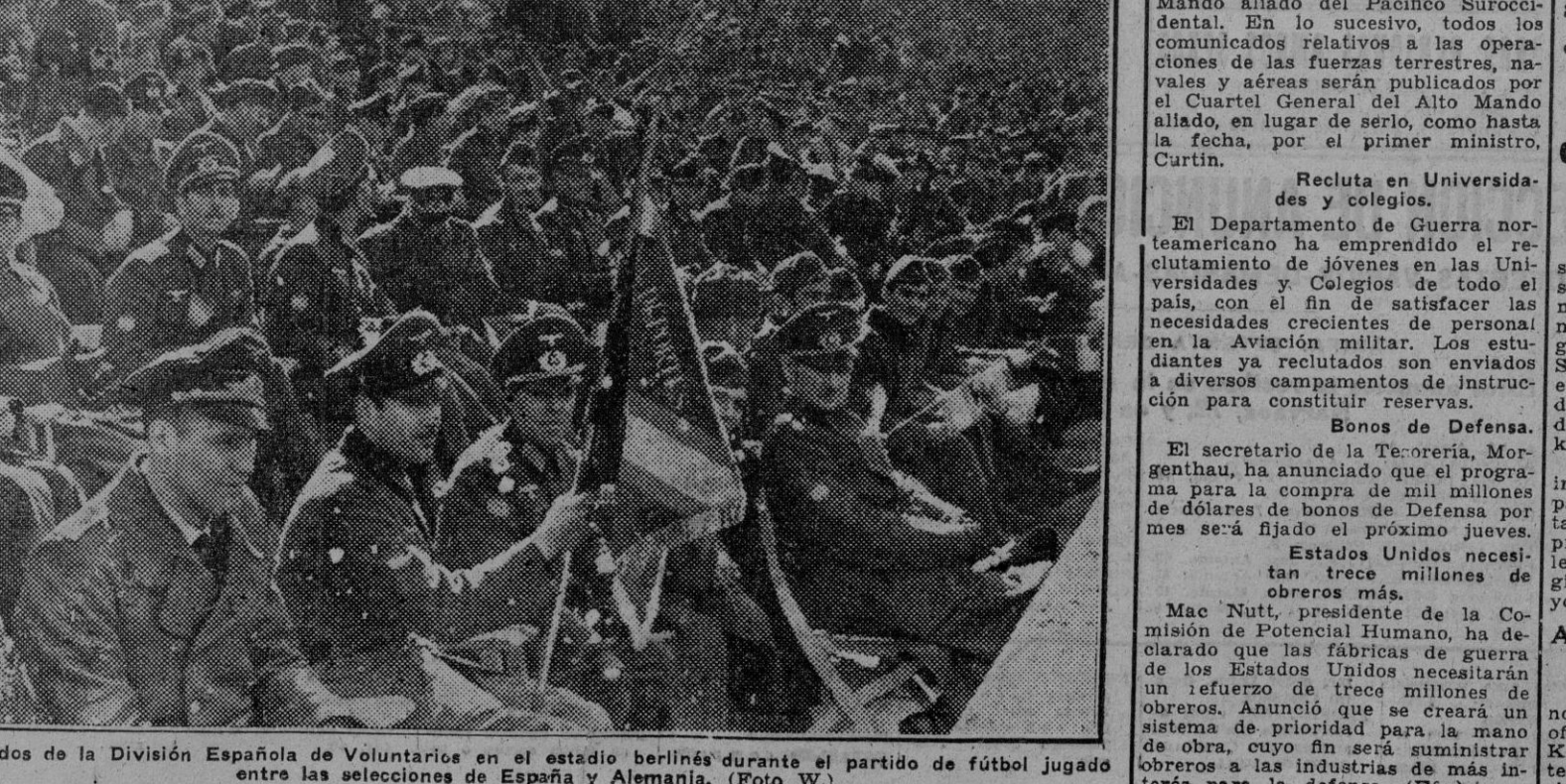
Soldados de la División Española de Voluntarios en el estadio berlinés durante el partido de fútbol jugado entre las selecciones de España y Alemania.