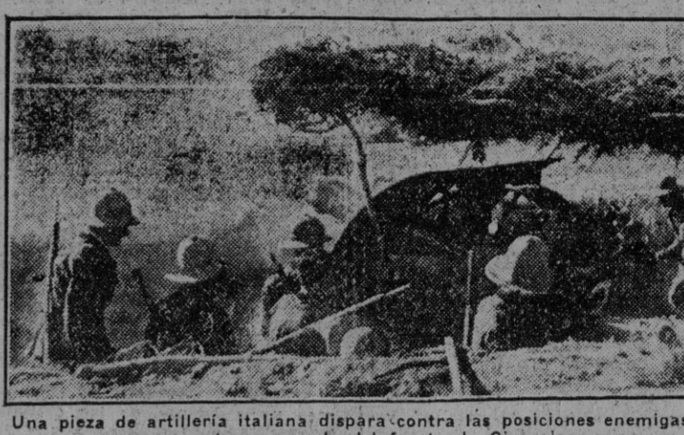
Una pieza de artillería italiana dispara contra las posiciones enemigas en un sector avanzado del frente de Cirenaica.