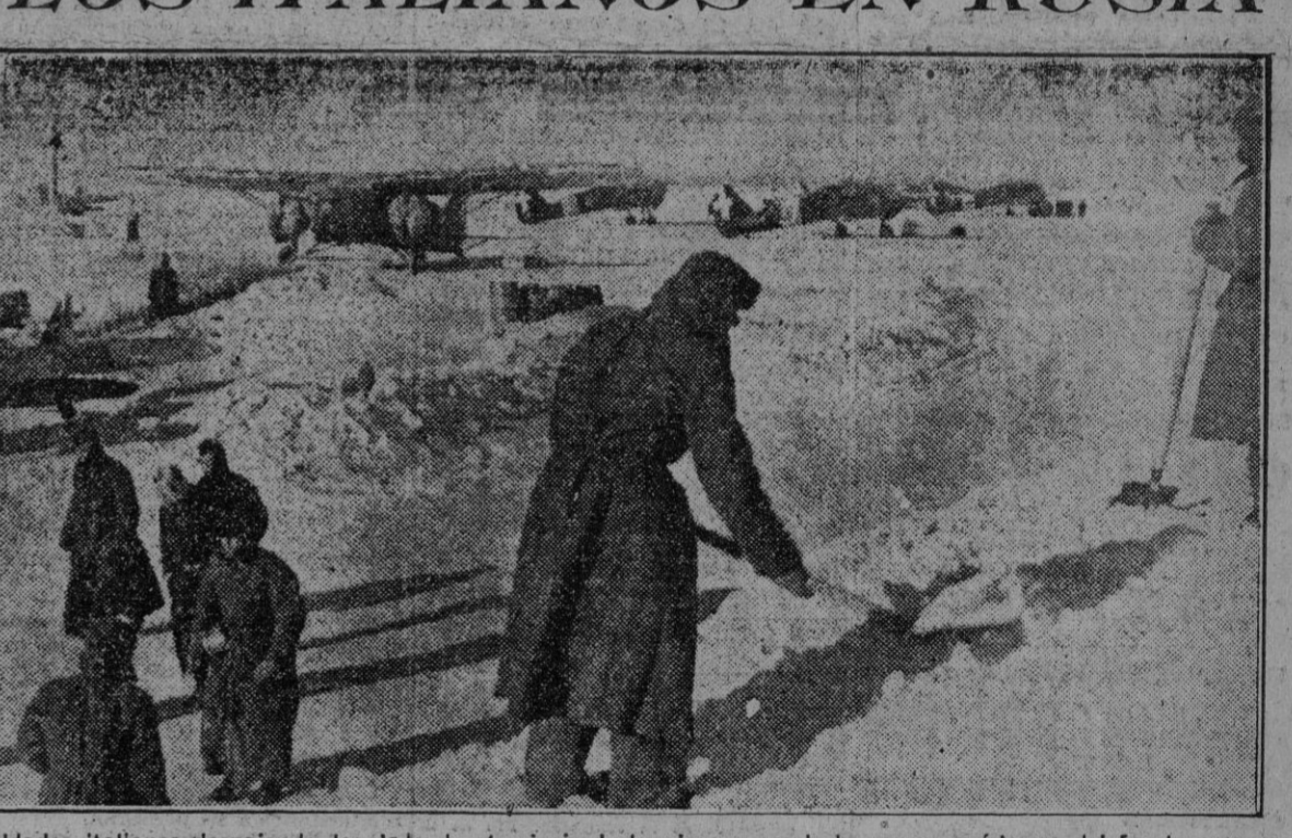
Soldados italianos despejando la pista de aterrizaje de la nieve acumulada en un aeródromo del frente ruso.