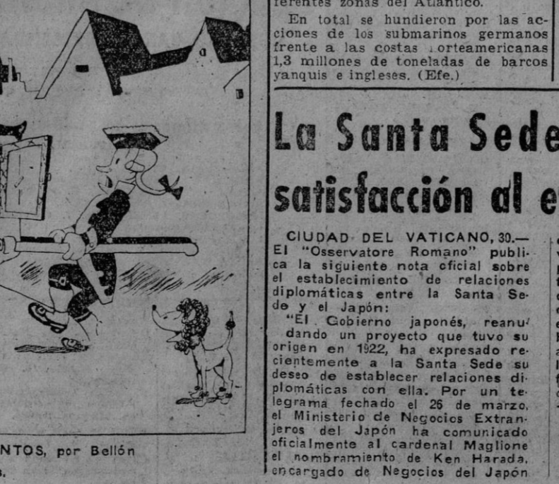
LOS GRANDES INVENTOS, por Bellón. Origen del freno a las cuatro ruedas.

El jefe nacional de la Obra 18 de Julio dijo que este no era un acto de propaganda a la antigua usanza. "Queremos una Nación—añadió—donde todos los hombres se unan en una empresa común, donde todos y cada uno permanezca en acto de servicio en la realización de una aspiración común en lo económico y en lo nacional. Para esto se han creado los Sindicatos. Estos no admiten la existencia de clases. Quiero que sepáis que son nuestros enemigos los que traicionan, bajo máscaras más o menos derechistas, especulan con la vida, encarecen las mercancías y critican la acción dura y callada de la Falange, y no en modo alguno los que piden solamente trabajo para poder vivir con dignidad. Debéis saber, además, que no se puede ser simplemente nacional; si a este concepto unimos el de sindicalista, entonces adquiere un sentido; así hemos forjado los Sindicatos: para ser simplemente nacional; si a nuestra disciplina, posibilidad de una lucha de clases. Yo os pido que todos en pie, con el alma en la gar-