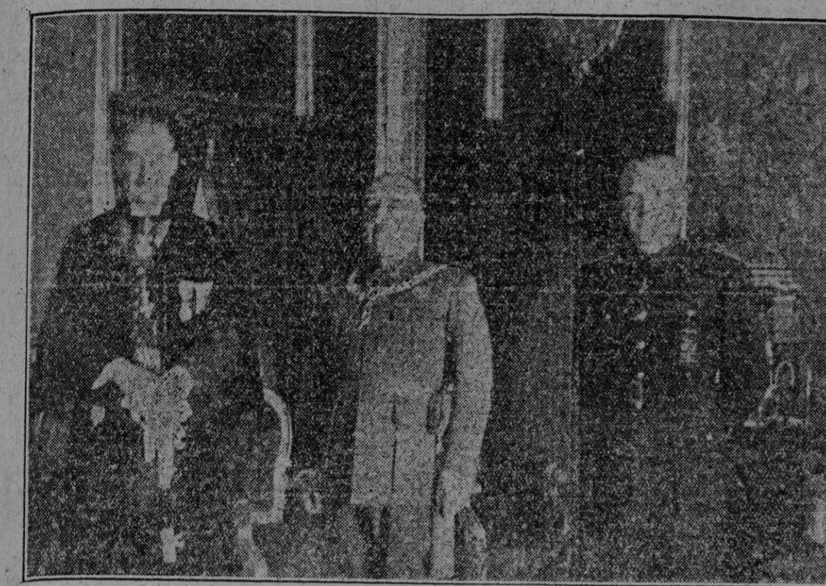
El ministro de Hungría en España, señor Ambro, ha impuesto esta mañana a S. E. el Jefe del Estado el Collar y Gran Cruz de la Orden del Mérito Agrícola, la más alta condecoración del reino de Hungría. Al acto asistió el ministro de Asuntos Exteriores

SOFIA, 30. (S. E. T.). La Dirección de la defensa pasiva exhorta a la población a seguir las instrucciones dictadas por las autoridades. Las medidas de obsecurecimiento y órdenes complementarias de defensa antiárea se deben interpretar únicamente como medidas de precaución inevitables en tiempos de guerra. (Efe.)