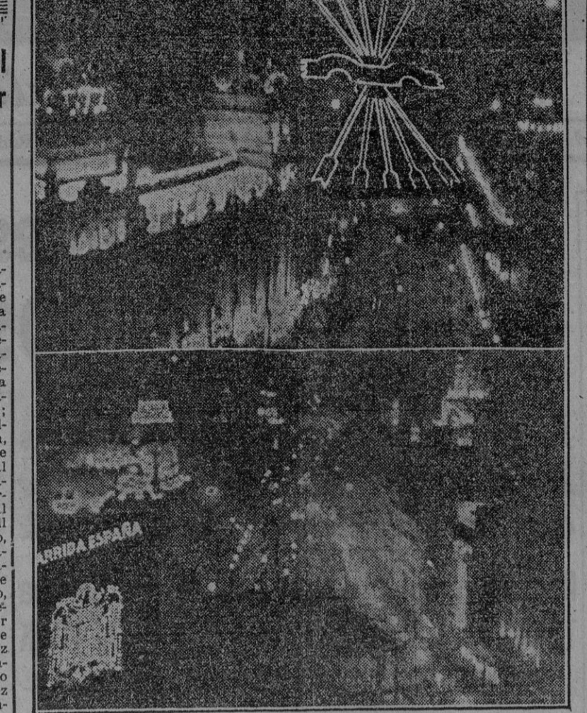
Magnífico aspecto que, con motivo del tercer aniversario de la liberación de Madrid, presentaba la calle de Alcalá, iluminada por los focos oficiales y bancarios y muchas casas particulares.