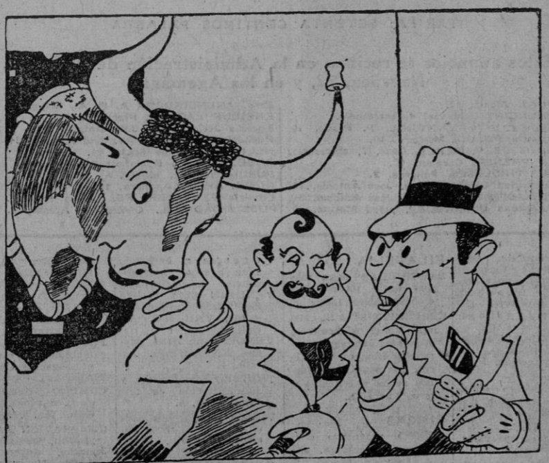
—¿Que si me acuerdo el día que me cogió? Váalo usted, compadre: ¡el siete de julio! ¡El siete del siete!

BERLIN, 12.—Toda la Prensa local publica largos artículos con motivo del LXV cumpleaños del ministro Reich Frick, quien los periódicos dedican grandes elogios. El "Voelkischer Beobachter" constata que, como funcionario, Frick es hombre de Estado, y el "Völkischer Beobachter" lema: "Todo para el Führer y todo para Alemania" (Efe).