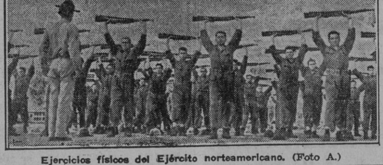
Ejercicios físicos del Ejército norteamericano. (Foto A.)