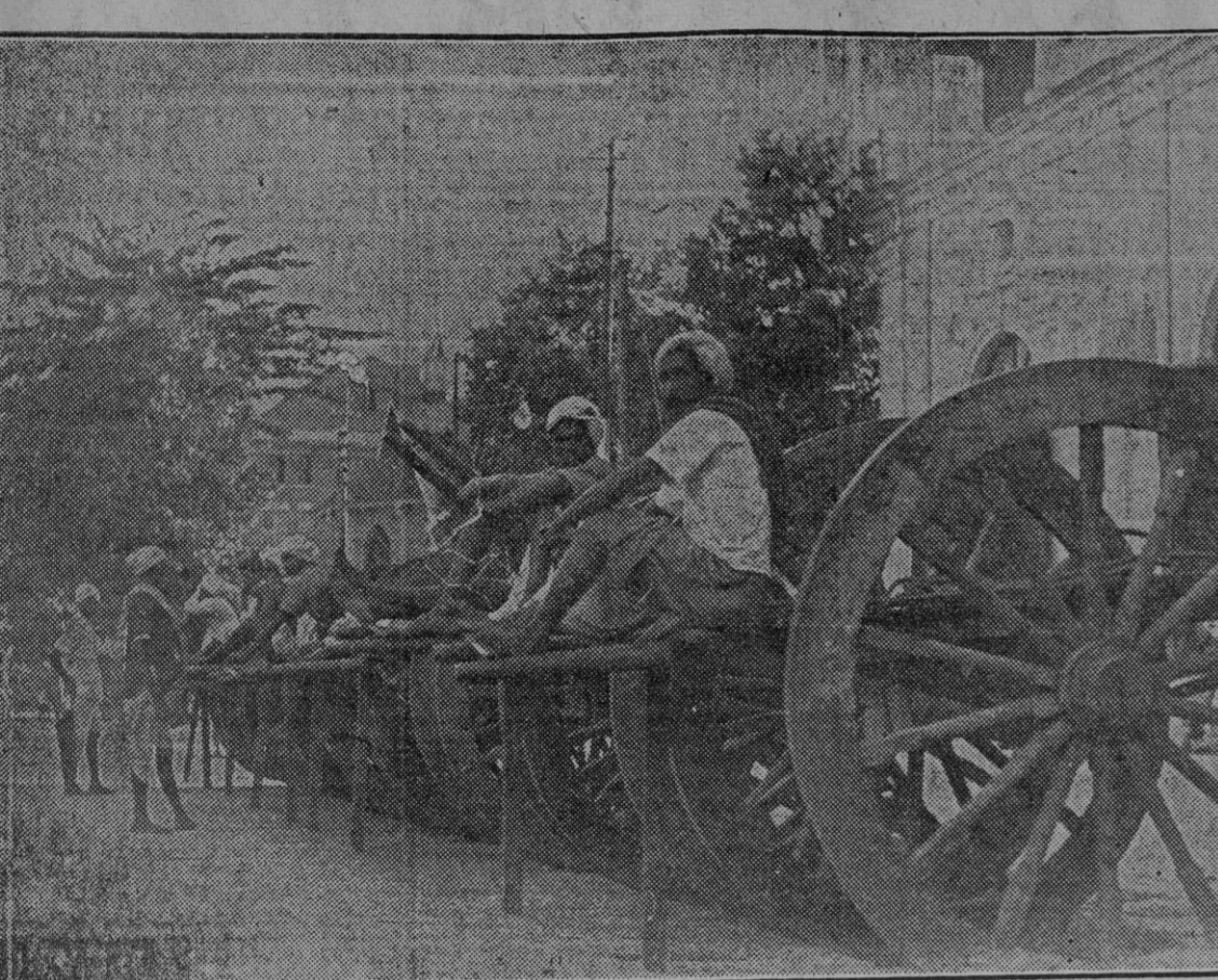
Los naturales de Rangún usan estos típicos carros de carga para trasladar las mercancías desde el puerto a la llamada "carretera de Birmania".