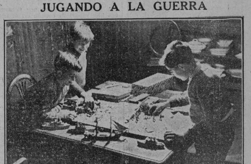
JUGANDO A LA GUERRA. No son mariscales todavía; pero sus inquietudes, a compás de la actualidad, les lleva a jugar a la estrategia, ni más ni menos que muchos hombres. Sítian sus soldados y sus escuadras respectivas, y a luchar. Hasta que sobre el teatro de operaciones caiga, como una bomba de 500 kilos una mano del papá obligando a estudiar Historia, Geografía y Latín a los beligerantes.